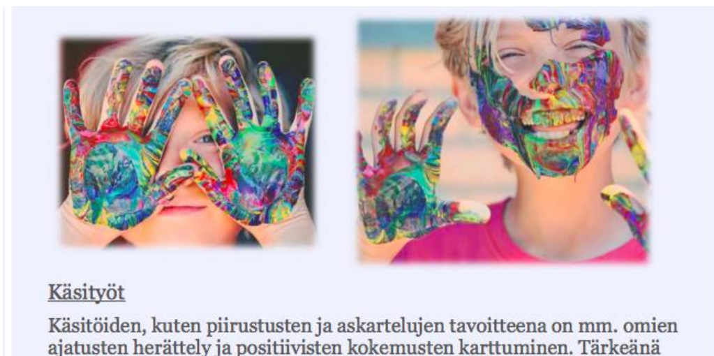
Kuva 3 Käsityöt

Oppaan todellinen sisältö sekä sen asiapohja rakennettiin opinnäytetyömme teoriaosuuden pohjalta. Aloitimme siitä, että määrittelimme käsitteet 'media' ja 'kasvatus' ja tämän jälkeen vasta aloimme puhua käsitteestä 'mediakasvatus'. Avasimme lukijalle myös muita mediakasvatukseen liittyviä käsitteitä kuten muun muassa: diginatiivi, monilukutaito, medialukutaito, mediakriittisyys ja mediakulttuuri. Kerroimme oppaassa myös mitkä kaikki asiat toimivat mediakasvatuksen välineinä niin varhaiskasvatuksessa kuin perheen arjessakin. Näitä välineitä ovat: kirjat ja lehdet, pelit ja leikit, Internet, älylaitteet ja sosiaalinen media, mediailmiot ja medialeikit, käsityö, musiikki, mediailmiot ja medialeikit sekä keskustelut.