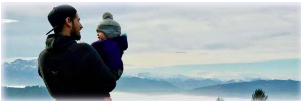
Kuva 2 Keskustelu

Oppaan todellinen sisältö sekä sen asiapohja rakennettiin opinnäytetyömme teoriaosuuden pohjalta. Aloitimme siitä, että määrittelimme käsitteet 'media' ja 'kasvatus' ja tämän jälkeen vasta aloimme puhua käsitteestä 'mediakasvatus'. Avasimme lukijalle myös muita mediakasvatukseen liittyviä käsitteitä kuten muun muassa: diginatiivi, monilukutaito, medialukutaito, mediakriittisyys ja mediakulttuuri. Kerroimme oppaassa myös mitkä kaikki asiat toimivat mediakasvatuksen välineinä niin varhaiskasvatuksessa kuin perheen arjessakin. Näitä välineitä ovat: kirjat ja lehdet, pelit ja leikit, Internet, älylaitteet ja sosiaalinen media, mediailmiot ja medialeikit, käsityö, musiikki, mediailmiot ja medialeikit sekä keskustelut.