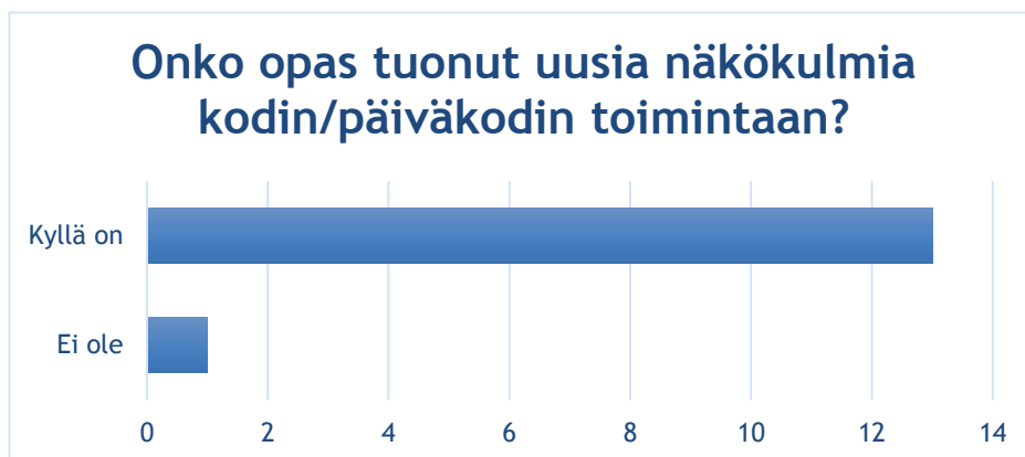
Taulukko 4 Kyselyn tulos 3

”Avasi sitä, miten mediakasvatus on osa päiväkodin arkea ja sitä, miten monipuolisesti mediakasvatusta tapahtuu niin päiväkodissa kuin kotonakin.”