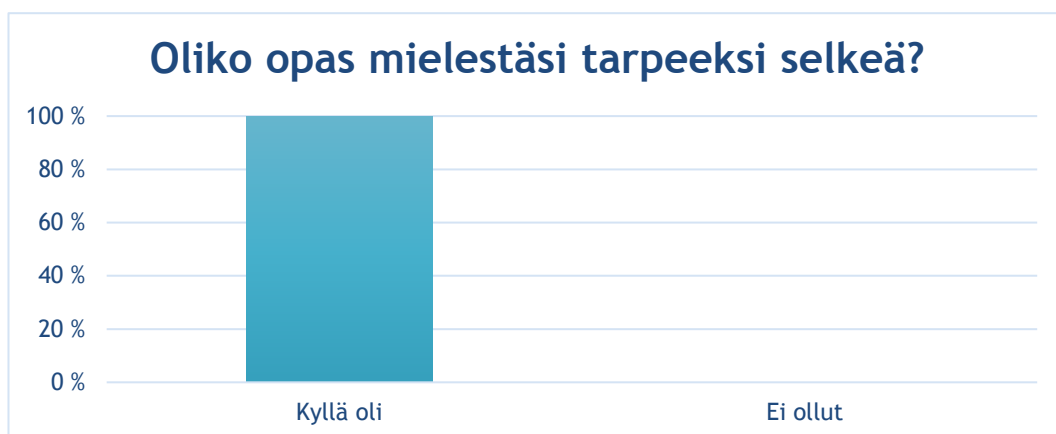
Taulukko 3 Kyselyn tulos 2

”Miellyttävä lukea, ei ollut liian pitkä, sisältö pidetty yksinkertaisena.”