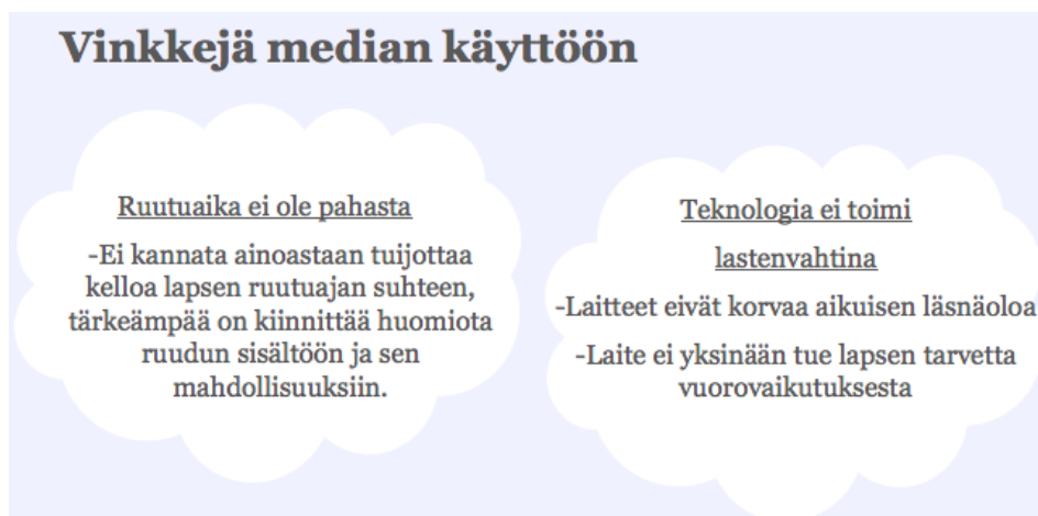
Kuva 4 Vinkkejä

nettikiusaaminen ja vaaranpaikat netissä. Näistä loimme viimeisille sivuille pienet vinkit ja muistiot, mitä niissä on hyvä ottaa huomioon.