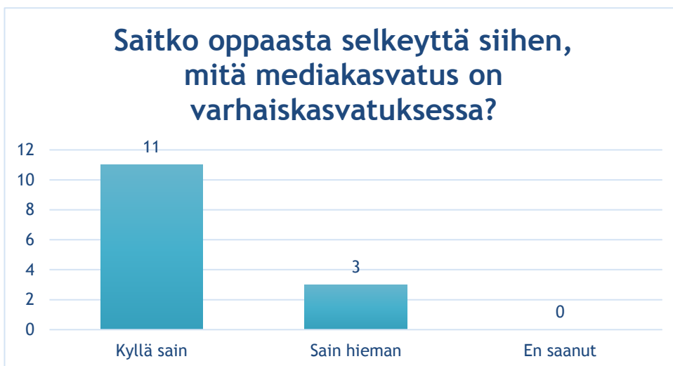
Taulukko 2 Kyselyn tulos

Seuraavaksi kysyimme, oliko oppaasta saatu selkeyttä siihen, mitä mediakasvatus varhaiskasvatuksessa on. Suurin osa 79% vastaajista oli sitä mieltä, että opas antoi selkeyttä mediakasvatuksesta. Loput 21% olivat sitä mieltä, että opas selkeytti hieman. Eli jokainen vastaaja sai ainakin vähän selkeyttä mediakasvatukseen, vaikka se ei tuttua olisikaan ollut.