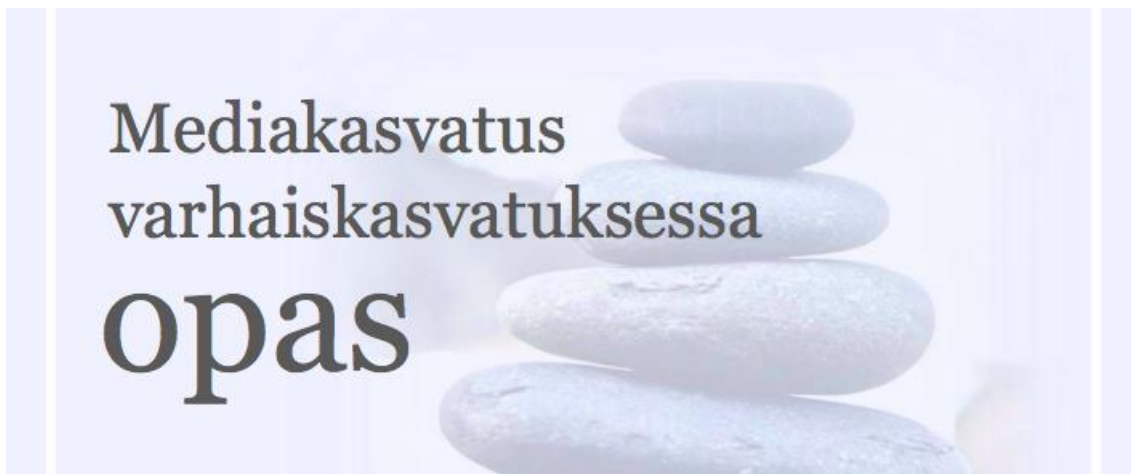
Kuva 1 Mediakasvatus varhaiskasvatuksessa -opas

Halusimme luoda oppaasta sekä selkeän että visuaalisesti miellyttävän lukijan silmälle. Selkeyttä oppaassa toteutimme muun muassa siten, että emme käyttäneet sen sisällössä ammattisanastoa, vaan helppolukuista suomen kieltä. Jos ammattisanastoa tuli kuitenkin käytettyä, tuli vaikeimmatkin käsitteet määriteltäviä, jotta lukija ymmärtää mistä on kyse. Mietimme myös tarkkaan otsikointien ja kappalejaon asettelua, jotta oppaan ilme, sisältö sekä sen helppolukisuus toteutuisi.