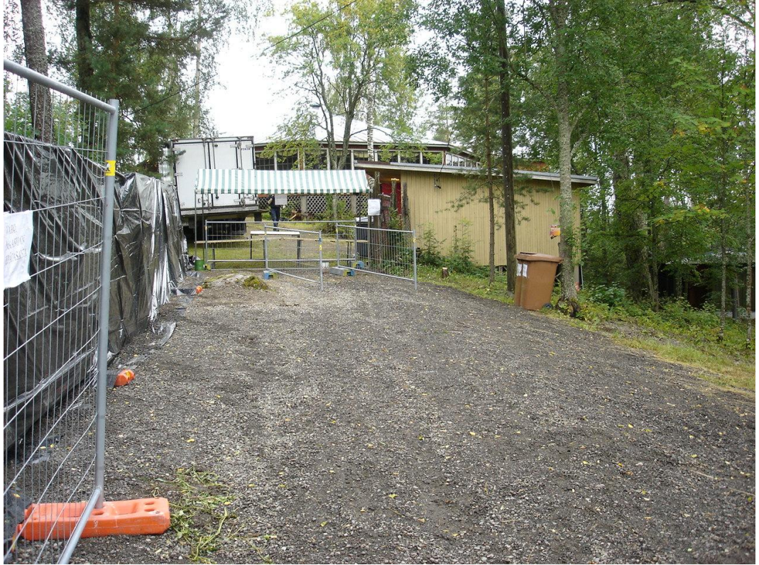
KUVIO 3: Anniskelualue

Pellavarockin wc-tilat sijaitsevat katselualueen molemmilla laidoilla, ja ne on sijoitettu havaintojeni mukaan varsin onnistuneella tavalla, joten tältä osin en löytänyt korjattavaa tai kehitettävää. Yleisöalueen oikealla laidalla oleva wc-alue koostuu siirreltävästä wc-tiloista, kuten erilaisista Bajamaja®-wc:istä, ja vasemmalla puolella olevat wc:t sijaitsevat kiinteässä wc-rakennuksessa.