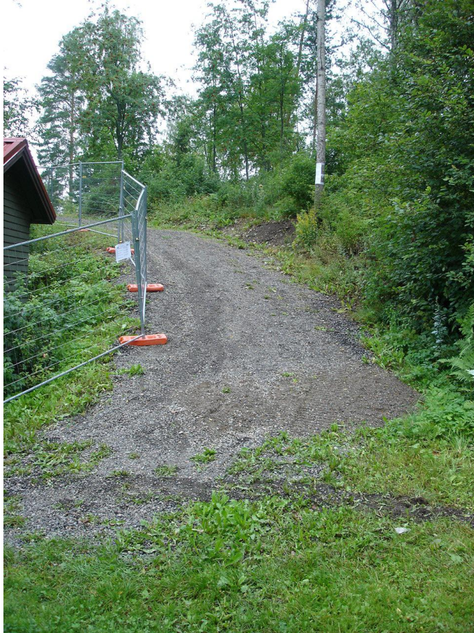
KUVIO 1: Kulkureitti alueelle

Tapahtuma-alueen esiintymislavat sijaitsevat nykyisellään ainoalla mahdollisella paikalla eli rinteiden juurella. Kuitenkin yleisöaluetta olisi mielestäni mahdollista laajentaa siirtämällä esiintymislavoja hieman taaksepäin lähemmäksi rantaviivaa. Tosin tällöin esiintyjien backstage-alue pienenesi jonkin verran, mutta havaintojeni mukaan tapahtuman esiintyjillä on varsin reilusti taukotilaa lavojen takana eikä bändien vaihtojen aikana tapahtunut suurempaa ruuhkautumista. Tavallisesti bändit lähtevät pois tapahtuma-alueelta pian oman esiintymisensä jälkeen, joten backstage-alueen ihmismäärä pysyy jotakuinkin vakiona koko tapahtuman ajan.