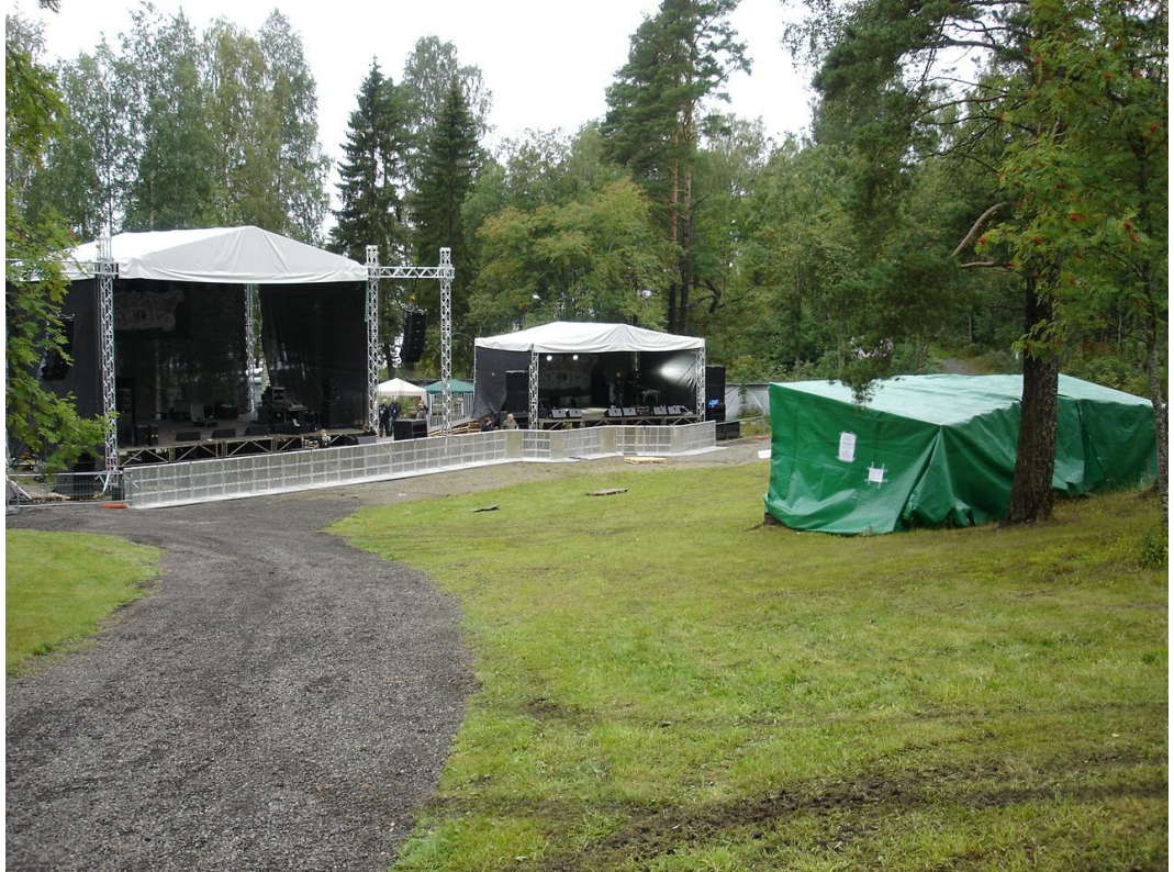
KUVIO 2: Tapahtuman katselualue ja esiintymislavat

teltta, josta ohjataan tapahtuman ääni- ja valotekniikkaa. Pellavarockin nykyinen anniskelualue jää kuvasta katsottuna alueen vasemmalle puolelle. Ympäröivän puuston määrästä voidaan myös nähdä, että Pellavarockin tapahtuma-alue sijaitsee hyvin luonnonläheisellä paikalla.