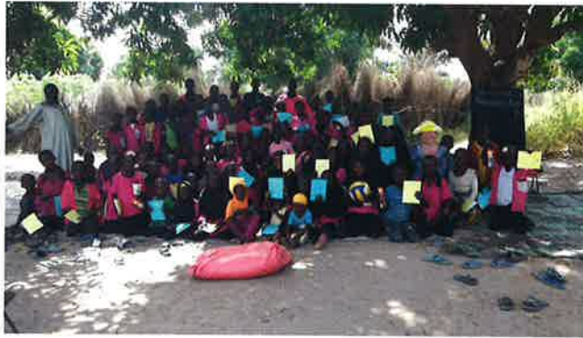
Länsi-Gambiassa sijaitsevan Mahmudan kylän Che Omar Muslim -koulun oppilaita on yli 70. Iältään he ovat 6-16 -vuotta. Lapsilla on yksi opettaja. Kaksi valtavan suurta mahonkipuuta toimii suojana auringolta, joka paistaa 356 päivää vuodessa.