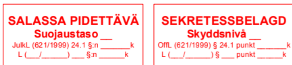
Kuva 3. Salassapitomerkinnot.

Seuraavassa kuvassa on esimerkkikuva salassapidosta kertovasta leimasta.