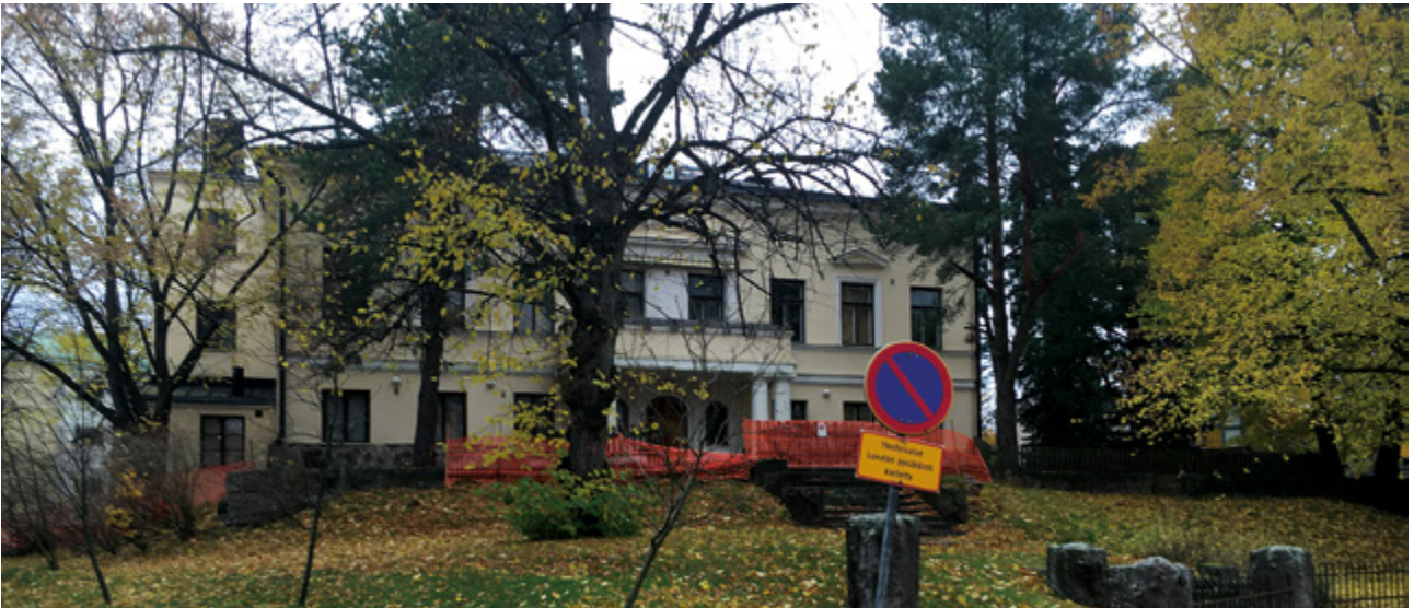
Lauttasaaren kartano 2016.

SATU SIRÉN, Miten Lauttasaaren kartano avautuu yleisölle? Kohtaamisia Koneen Säätiön tyyliin. 2017.