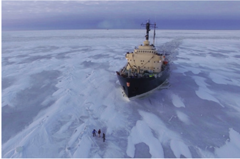
Kylmää kyytiä ja jäätävää osaamista! Duudsonit kilpailmassa jäänmurtajaa vastaan.