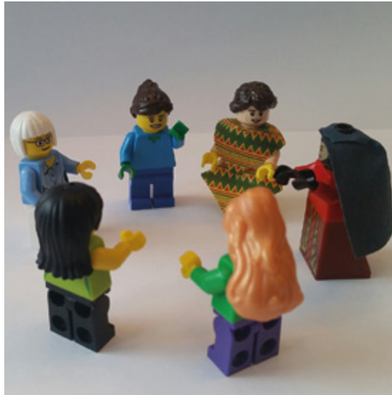
Maahanmuuttajajäideille suunnatun kurssin ryhmäkoko kannattaa pitää pienenä, jotta kaikkien oma osaaminen ja tarpeet voidaan ottaa huomioon.

sijaan pelko epäonnistumisesta, syyttämisestä ja tuomitsemisesta vähentää luovuutta ja oppimista sekä estää voimaantumista. Kurssiryhmän naiset toivoivat jatkossakin erityisesti naisille järjestettyjä kursseja. Myös kurssin ohjaajat kokivat vertaisuuden ja samankaltaisuuden kokemuksia naisryhmän jäsenten kanssa hyvin erilaisista lähtökohdista ja taustoista huolimatta.