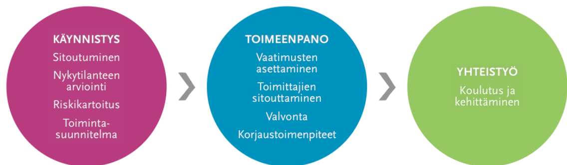
Kuva 1. Toimitusketjun vastuullisuuden edistäminen. (FIBS 2018e).

tunnistaminen voi olla haastavaa, mutta esimerkiksi sosiaaliseen vastuuseen liittyy paljon riskejä mm. lapsityövoiman käytöstä, korruptiosta ja työturvallisuudesta. Riskikartoituksen tehtävänä on auttaa tunnistamaan ne toimittajat, joiden vastuullisuustoiminta ei ole varmaa, jolloin yritys voi kohdentaa omia toimiaan ko. yritysten kanssa. (FIBS 2015d). Kun yritys on laatinut toimittajilleen vaatimuksia, esimerkiksi code of conduct -ohjeistuksen tai standardien käyttämisen, tulee vaatimusten täyttämistä valvoa. Yleisesti ulkopuolisten tahojen tarkastukset koetaan uskottavimmiksi. Aina jos toimittaja on sertioitu, tarkastuksen täytyy hoitaa ulkopuolinen taho. Yrityksen on hyvä miettiä, seuraako standardien rikkomisesta rangaistus ja kuinka usein on tarvetta tarkastuksille. (FIBS 2015f). Suomalaisyrittäjillä ei ole tapana purkaa sopimuksiaan, vaan ne pyrkivät korjaamaan epäkohdat ja ongelmat. Tätä voidaan pitää vastuullisena toimintamallina. (FIBS 2015b).