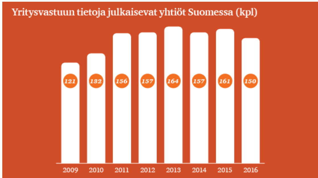
Kuva 2. PwC Suomen yritysbarometri. (PwC 2017b).

PwC (PricewaterhouseCoopers Oy) on yritys, joka auttaa yrityksiä raportoimaan luotettavasti ja luomaan kestävästä kasvusta sekä tehostamaan toimintojaan. (PwC 2018a). PwC Suomi julkaisee vuosittain yritysbarometrin, joka on laajin suomalaisyrityksiä ja niiden yritys vastuuta kartoittava selvitys. PwC on julkaissut uusimman yritysbarometrinsa elokuussa 2017. Kuvassa kaksi on kuvattu yritys vastuun tietoja julkaisevien yhtiöiden määrää Suomessa vuosittain. Kuvan mukaan määrä on pysytellyt suhteellisen samana vuosien 2011–2016 aikana.