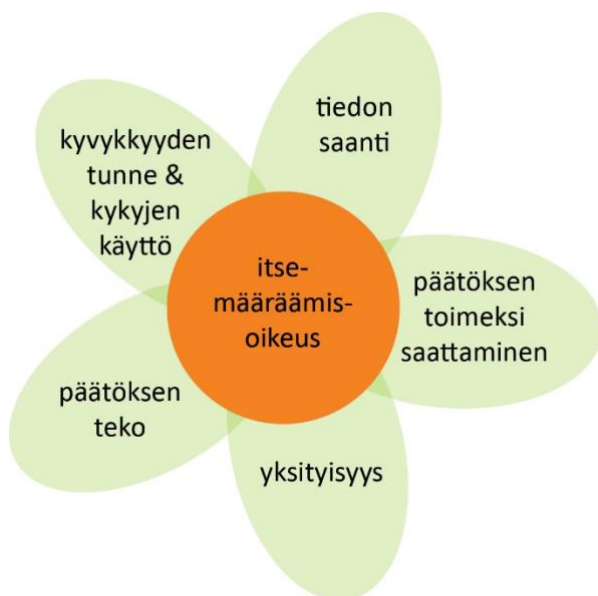
Kuvio 2. Itsemääräämisoikeuden ulottuvuudet (Topo 2013)

valinnoista, kuten lounasvaihtoehdon valinnasta. Topo kuvaa artikkelissaan itsemääräämisoikeutta ja sen eri ulottuvuuksia alla olevan kukan avulla. Mikäli jokin osa-alue ei toteudu ihmisen elämässä, ei toteudu myöskään aito itsemäärääminen. (Topo 2013.)