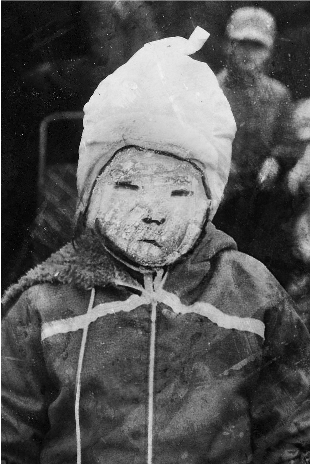
Juliste animaatiosta Kun olin pieni