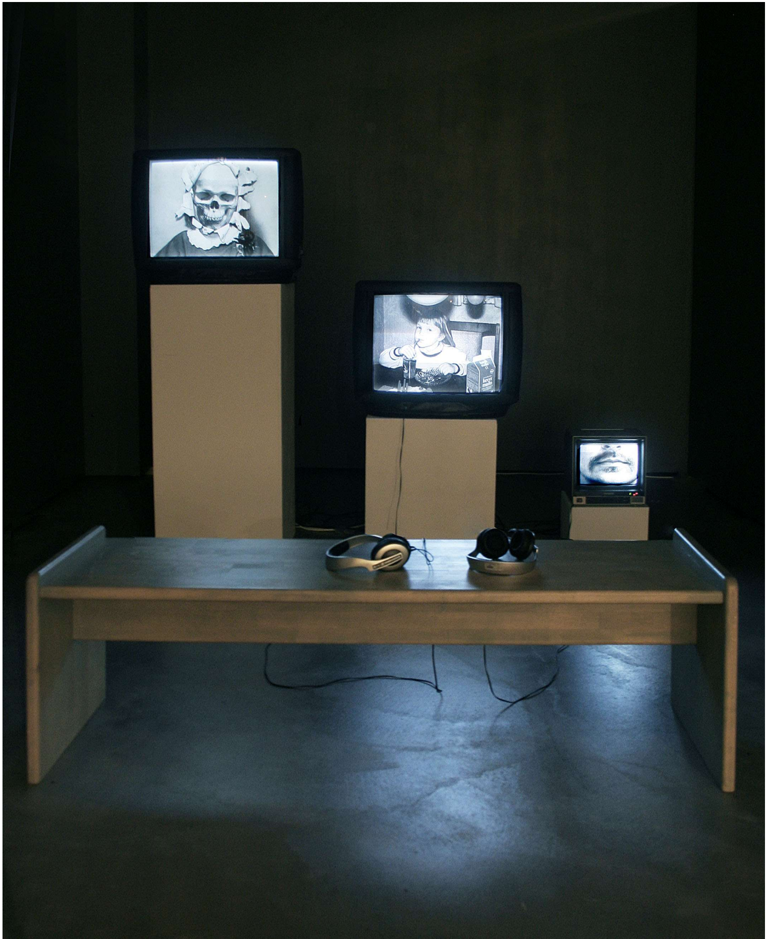
Installaatio Taidehalli TR1:ssä