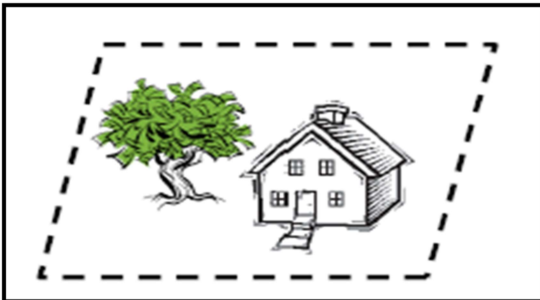
Kuvio 1. Kiinteistö (Vitikainen 2014, 1)

Kiinteistö on rajattu alue joko maalla tai vedessä (Kuvio 1) ja siihen kuuluu myös osuudet yhteisiin alueisiin ja yhteisiin erityisiin etuuksiin. Osana kiinteistöä on myös siihen kuuluvat rasiteoikeudet ja yksityiset etuudet. (Vitikainen 2014, 1.) Lohkomisen päätarkoituksena on vahvistaa uuden muodostettavan kiinteistön rajat (Maanmittauslaitos 2014).