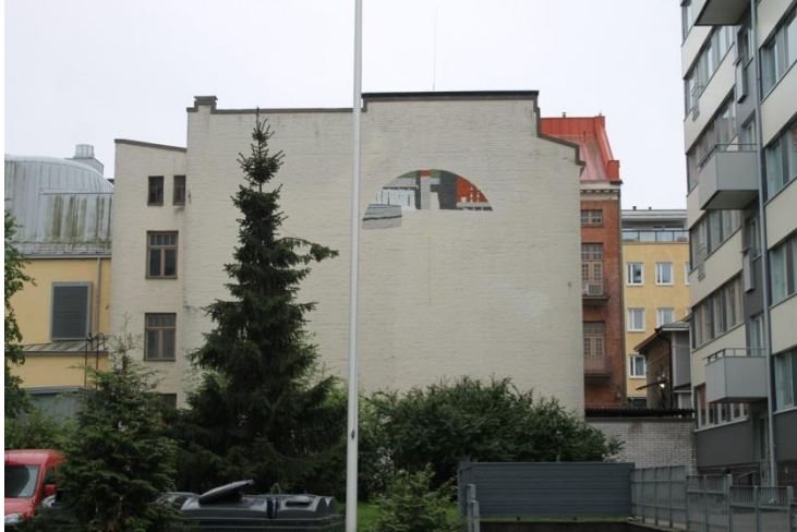
Kuva 5. Keskeneräinen maalaus: tehdasrakennuksia, koskea ja puiston aitaa.