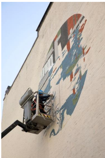
Kuva 6. Keskeneräinen muraali. Veden maalaaminen teippisapluunoilla.