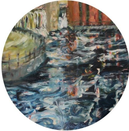
Kuva 3. Luonnosmaalaus: Tiina Kaisa Leppänen.