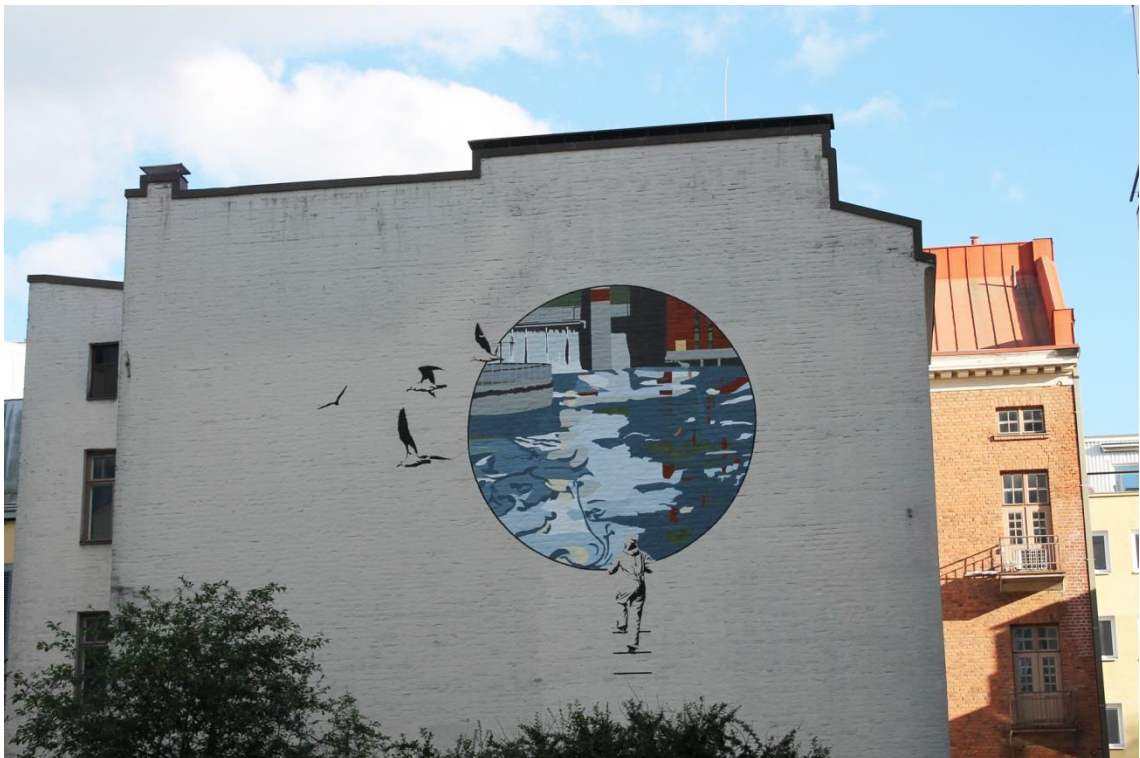
Kuva 10. Valmis Kyttälän muraali.

Lähetin kuukausi seinämaalauksen valmistumisen jälkeen palautekyselyn (liite 3) niille kyselylomakkeen täyttäneille ihmisille, jotka jättivät sähköpostiosoitteensa kyselylomakkeeseen. Heitä oli yhteensä 12 henkilöä. Laitoin liitteeksi valmiin Kyttälän muraalin kuvan (kuva 10). Sain palautekyselyyni neljä vastausta. Laitan tähän joitakin poimintoja sähköpostitse saamastani Kyttälän muraalin palautevastauksista (2017) Vastaaaja 2: ”Pidin tärkeänä veden vauhtia ja sitä kuvassa on! Mielipiteeni otettiin huomioon, pidin tärkeänä myös maltillista väriskaalaa.” Vastaaaja 1: ”minusta oli kiva että kysymykset esitettiin. Tämä Koskipuisto on lähinnä minua ja siksi tärkeä.” Vastaaaja 3: ”toivoimme rouvan kanssa, että vappu esim. haalarit näkyisivät kuvassa. Ja näkyiväthän ne.”