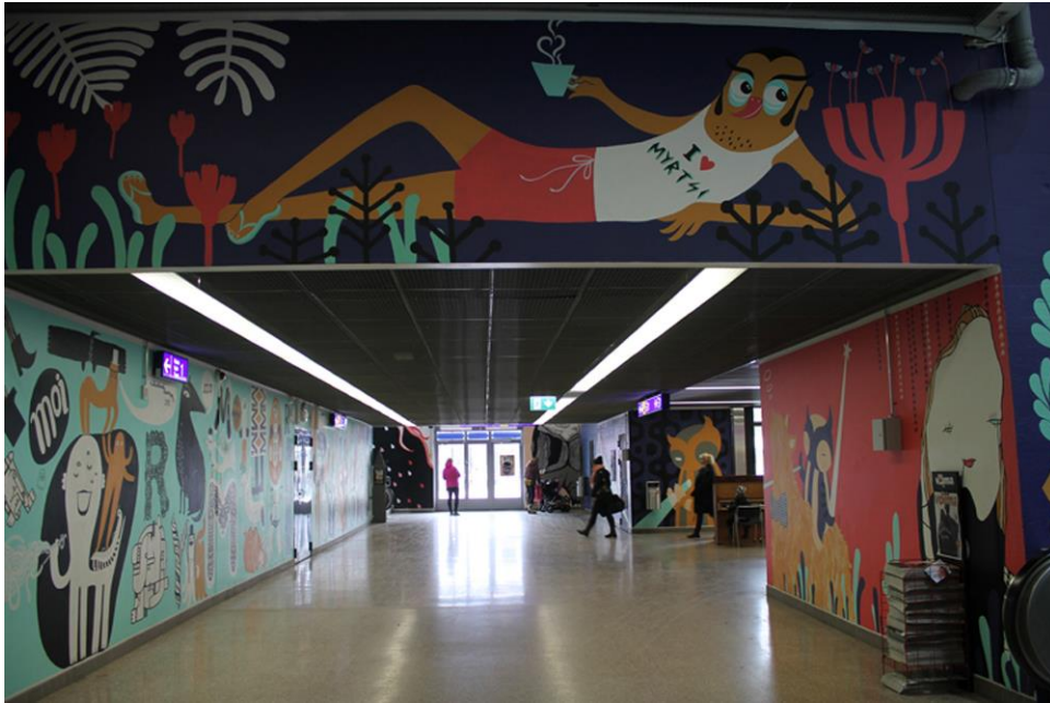
Kuva 1. Myyrmäen asema Vantaa 7.4.2017. Kuvaus: Miina Laine.

Vantaalla oli keväällä 2017 käynnissä katutaiteen suurhanke Seinähullu Vantaan (2017) järjestämä kilpailu, johon haettiin seinämaalareita. Valitut taiteilijat pääsivät opettelemaan muraalin tekoa ulkomaisten taiteilijoiden kanssa kesällä 2017. Lisäksi valitut suomalaiset taiteilijat saavat tehdä oman muraalin Vantaalle kesällä 2018. Seinähullu Vantaa -projektissa on mukana Vantaan taidemuseo Artsi, Street Art Vantaa, Street Art Today sekä Seinähullu Hakunila -facebook-ryhmä. Kahden vuoden aikana Vantaalle toteutetaan 12 muraalia Seinähullu Vantaa -hankkeen toimesta. (Katutaiteen suurhanke Seinähullu Vantaa alkaa 2017.).