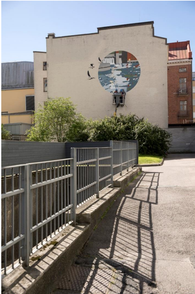
Kuva 7. Tyttöhahmon maalaaminen.

Seuraavaksi Miina Laine maalasi linnut ja tyttöhahmon (kuva 7) spraymaalilla ja minä avustin häntä pitämällä kiinni sapluunoista .