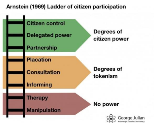
Kuva 11. Arnstein(1969) Ladder of citizen participation (Arnstein 1969; Julian 2013).

Toteutuiko kaupunkilaisten osallisuus Kyttälän seinämaalauksessa? Arnsteinin (1969) Ladder of citizen participation (kuva 11) eli osallisuuden tikapuut-määritelmän mukaan osallisuuden tasoja on kahdeksan (Arnstein 1969; Rinne).