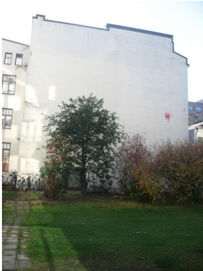
Kuva 2. Paikka seinämaalaukselle. Näkymä Rongankatu 2:n puolelta Tampereelta.