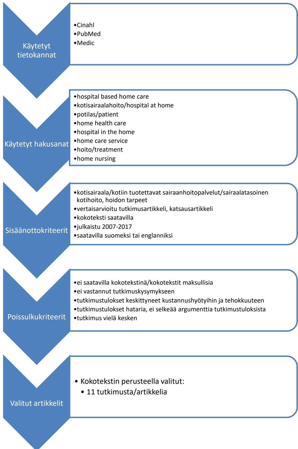
KUVIO 3. Aineistonhakuprosessi