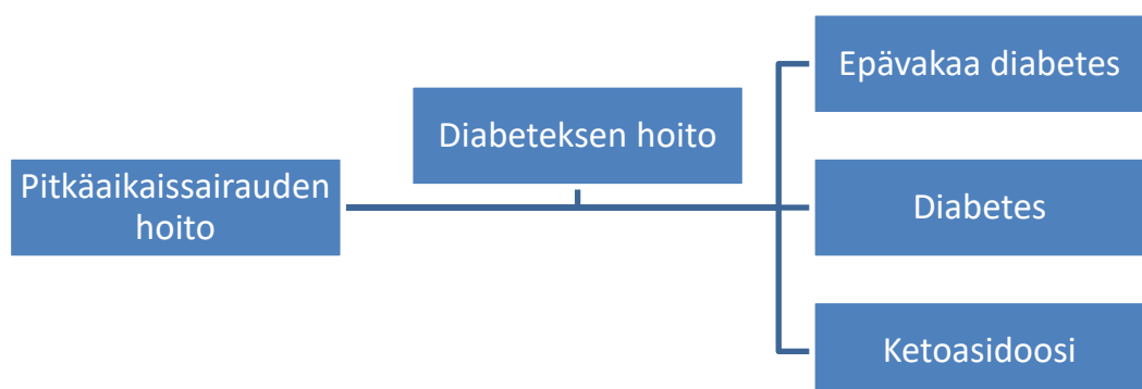
KUVIO 5. Esimerkki sisällönanalyysin toteuttamisesta

Aineistonhakuja tehdessä, olin valinnut aineistot niiden kokotekstien perusteella. Kun olin kerännyt kaiken aineiston opinnäytetyötä varten, aloin lukea niitä läpi tarkemmin ja kääntämään kokotekstejä. Alleviivasin aineistoista esiin tulleet, tutkimuskysymykseen vastaavat alkuperäisilmaukset ja pelkistin ne tiiviimpään muotoon suomeksi. Numeroin jokaisen tutkimuksen ja merkitsin numeron niistä löytyneiden pelkistysilmausten perään taulukoidessa ilmauksia. Listasin pelkistetyt ilmaukset taulukkoon ja kokosin ne niitä yhdistäviin kokonaisuuksiin, joista muodostuivat yhteneväiset alaluokat. Alaluokat jaottelin omiin ryhmiinsä, joista muodostuivat analyysin yläluokat. Luokittelua ohjasi koko ajan tutkimuskysymys (kuvio 5).