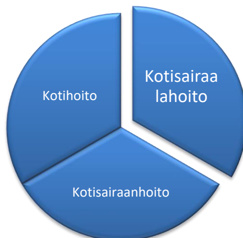
KUVIO 1. Kotiin tuotettavat sairaanhoitopalvelut

Kotihoito on sosiaalihuoltolain (1301/2014) mukaan kotisairaanhoidon tehtävien ja kotipalvelun muodostama kokonaisuus. Kotipalvelu tarkoittaa asumisen, hoidon ja huolenpidon, toimintakyvyn ylläpitämisen, asioinnin, lasten hoidon ja kasvatuksen ja muiden jokapäiväiseen elämään kuuluvien tehtävien suorittamista ja niissä avustusta.