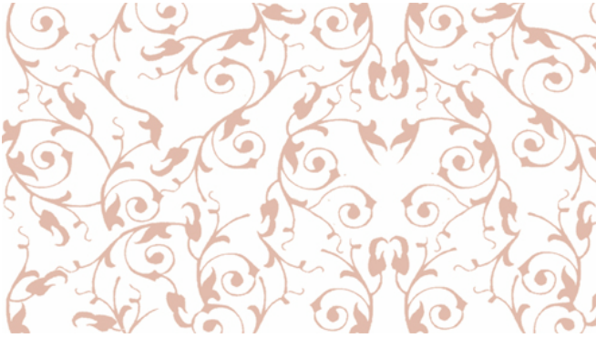
KUVA 3. Kuvapohja.

Toisessa versiossa meillä oli albumisivuilla kolme tai neljä kuvaa sivua kohden. Kolmen kuvan sivuissa oli yksi pystykuva (KUVA4). Syy maksimissaan neljän kuvan sääntöön oli se, että halusimme katsojan ehtivän näkemään jokaisen kuvan sekä halusimme ulkoasun olevan siisti ja selkeä. Pohjiin haluttiin mukaan myös tekstiä ja se oli mahdollista vain silloin, kun pohjat eivät olleet täynnä kuvia. Väliarvioinnissa tilaaja kuitenkin toivoi, että kuvia olisi joillain sivuilla enemmän. Toiveena oli saada mukaan kollaasimaisia kuvapohjia (KUVA5), joissa kuvat menisivät osittain päällekkäin. Tilaajan toiveet huomioitiin ja laitoimme lopulliseen versioon albumisivuja, joissa kuvia oli useampi sekä järjestys huolettomampi. Neljän ja kolmen kuvan sivut säilyivät silti vahvasti mukana, jotta historiikin seuraaminen ei olisi katsojalle liian vaivalloista ja mukaan mahtuisi välillä myös tekstiä.