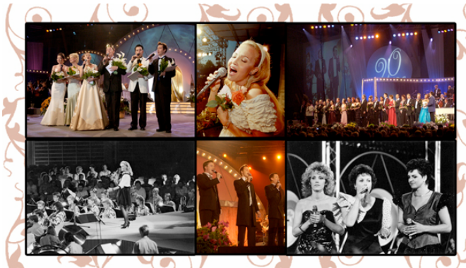
KUVA 5. Kollaasikuva.

Kuvien sommittelussa tuli ottaa monta asiaa huomioon. Mustavalkoisten ja värillisten kuvien yhdistäminen vaati harkintaa. Samalla sivulla pystyttiin esimerkiksi käyttämään kahta värillistä kuvaa ja yhtä mustavalkoista kuvaa, mutta toisinpäin kuvien välinen eroavaisuus oli häiritsevää. Oli mahdotonta erotella kaikkia mustavalkokuvia erillisille sivuille, koska kuvapohjia olisi sen johdosta jouduttu tekemään huomattavasti enemmän. Toisaalta juuri värierot toivat kontrastia ja niiden avulla katsojalle korostui ajan kulku.