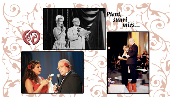
KUVA 4. Kolmen kuvan esimerkki.

Toisessa versiossa meillä oli albumisivuilla kolme tai neljä kuvaa sivua kohden. Kolmen kuvan sivuissa oli yksi pystykuva (KUVA4). Syy maksimissaan neljän kuvan sääntöön oli se, että halusimme katsojan ehtivän näkemään jokaisen kuvan sekä halusimme ulkoasun olevan siisti ja selkeä. Pohjiin haluttiin mukaan myös tekstiä ja se oli mahdollista vain silloin, kun pohjat eivät olleet täynnä kuvia. Väliarvioinnissa tilaaja kuitenkin toivoi, että kuvia olisi joillain sivuilla enemmän. Toiveena oli saada mukaan kollaasimaisia kuvapohjia (KUVA5), joissa kuvat menisivät osittain päällekkäin. Tilaajan toiveet huomioitiin ja laitoimme lopulliseen versioon albumisivuja, joissa kuvia oli useampi sekä järjestys huolettomampi. Neljän ja kolmen kuvan sivut säilyivät silti vahvasti mukana, jotta historiikin seuraaminen ei olisi katsojalle liian vaivalloista ja mukaan mahtuisi välillä myös tekstiä.