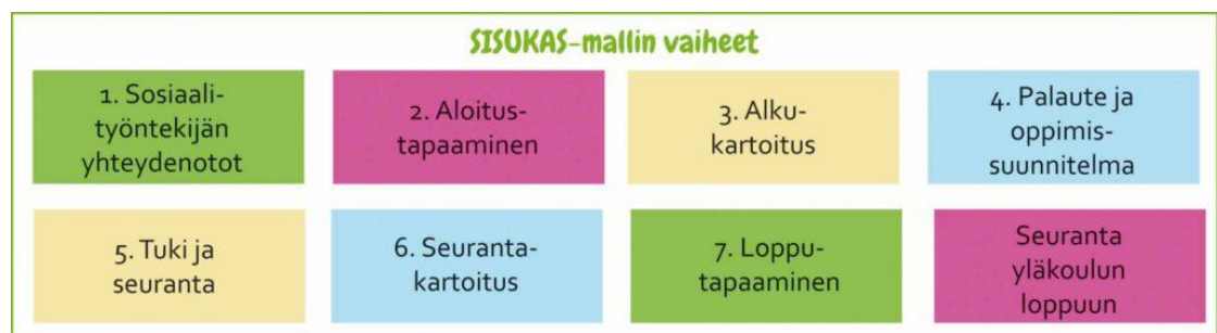
Kuva 1. Sisukas-mallin vaiheet (Pesäpuu 2014b)

Sisukas-projektin alkuvaiheessa 2013 oli mukana seitsemän sosiaalityöntekijän asiakaslapsia viidestä eri kunnasta. Lasten tilanne kartoitettiin aluksi kokonaisvaltaisesti lapsen hyvinvoinnin ja oppimisvaikeuksien osalta. Alkukartoituksessa tutkittiin myös lapsen tunne-elämää ja sosiaalisia taitoja. Alkukartoituksesta selvisi, että kaikilla projektiin osallistuneilla lapsilla oli tarvetta yksilölliseen tukeen koulunkäynnissä. Alkukartoituksen pohjalta lapsille toteutettiin lapsen tarpeista lähtevää tukea kouluun ja sijaisperheeseen. Tukimuotoina käytettiin mm. oppiaineiden pilkkomista, koulupäivän keventämistä, pienryhmäopetusta, lukemisen ja matematiikan harjoitteluhelmien avulla sekä kannustamalla pienissäkin onnistumisissa. Lisäksi lasten sosiaalisia ja tunnetaitoja pyrittiin edistämään. Lapsille tehtiin yksilölliset oppimissuunnitelmat joihin kirjattiin tavoitteet ja vastuut. Verkosto kokoontui neljästi vuodessa seuraamaan ja päivittämään tukitoimien toteutumista. Lapsia pyrittiin osallistamaan eteenkin palavereissa. (Pesäpuu 2014a, 3.)