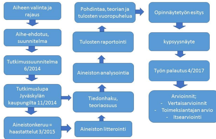
Kuva 2. Opinnäytetyöprosessi