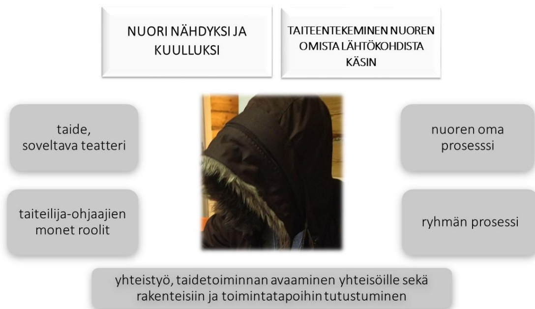
Kuvio 5: Taidetyöskentelyä mahdollistavia ja tukevia asioita, Anne Korhonen 2017.

Soveltava teatteri voi olla esitykselliseen muotoon tähtäävää, tai puhtaasti prosessoivaa tai niitä molempia yhdistävää. Olipa soveltava teatteri kumpaa tahansa, on sille useimmiten tyypillistä yhteisöllisyys, osallistavuus, ryhmälähtöisyys, dialogisuus, tutkivuus, interaktiivisuus sekä reflektointi. Se on usein myös yhteiskunnallista ja tähtää voimauttamiseen, valtauttamiseen ja muutokseen. Soveltavalle teatterille on tyypillistä toimia monenlaisissa ympäristöissä ja tiloissa. Soveltava teatteri on usein jalkautuvaa, se menee sinne, missä ihmiset ovat ja tekee näkyväksi autenttisia ympäristöjä ja siellä olevia ihmisiä, mutta toimii myös teatterillisissa maisemissa. (Louhija 2015, 80.)