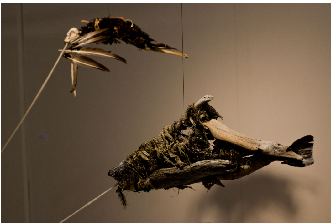
Yksityiskohta teoksestani ”Maan ja Taivaan Välillä” (2017)

Teoksen osasiin sisältyy tarinoita. Ne ovat minulle symbolisia osia, joista olen tässä työssä koostanut isomman kokonaisuuden. Teoksen kaikki osat yhtä lukuun ottamatta on kerätty mereltä. Se yksi osa on silmän paikalle asetettu kotilon kuori. Tämä kotilo on Kankaanpäästä. Toisena silmänä on Reposaaressa löydetty kivi, jonka maalattu kuva on myös teossarjassani ”Hiotut Hiomattomat”. Omakuvallisuutta ajatellen on mielenkiintoista ajatella mereltä löytyneen silmän edustavan suhdettani maailmaan, jossa meri asettuu keskiöön. Kankaanpäästä löydetyn kotilosilmän taas ajattelen kuvaavan taiteellisen silmän kykyä nähdä enemmän.