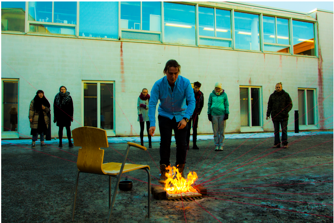
Luopuminen (2017) installaatioperformanssi.

Pidän tietyllä tapaa tätä teostani myös päättötyönäni. Todellinen päättötyöni on esitys oppimisestani maailmalle, mutta tämä teos on paremminkin omistettu koulu yhteisölle ja uusille polville. Tämä on oodi yhteisölle, josta irtaannun lankojen palossa. Tämä yhteisö jää minuun muistoissa, ja pääsen sieltä vapaana näyttämään oppimaani maailmalle. Feeniks linnun on kuoltava palossaan, jotta hän voi nousta tuhkasta.