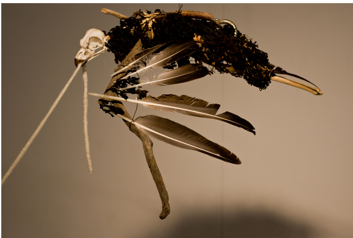
Yksityiskohta teoksestani "Maan ja Taivaan Välillä" (2017)

Lintuteoksen materiaaleina olen käyttänyt rakkolevää, ajopuita ja eläinten osia. Rakkolevän käyttö oli oleellista työn kannalta, koska se on ollut viherlevän ohella tärkeä löydös teosmateriaalina.