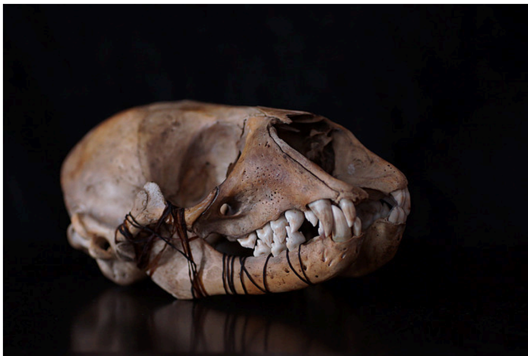
Hylkeen kallo. preparointi ja kuva. Korkee Mikael (2014)

tunteet lisäsivät käsitystä maailman ja mieleni ainutlaatuisuudesta. Lopulta ajauduin siihen, että kaikki oli suuren pienen mieleni varassa.