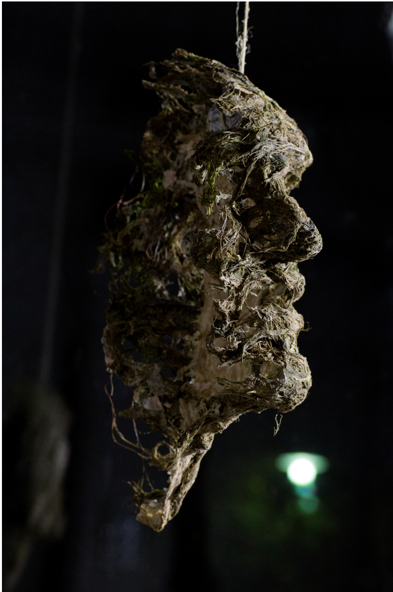
Kasvot (2014) (teosmateriaali: merilevä) Korkee Mikael