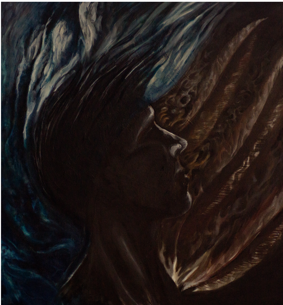
Teoskuva "Mielenmuutoksia" (omakuva, 2013)