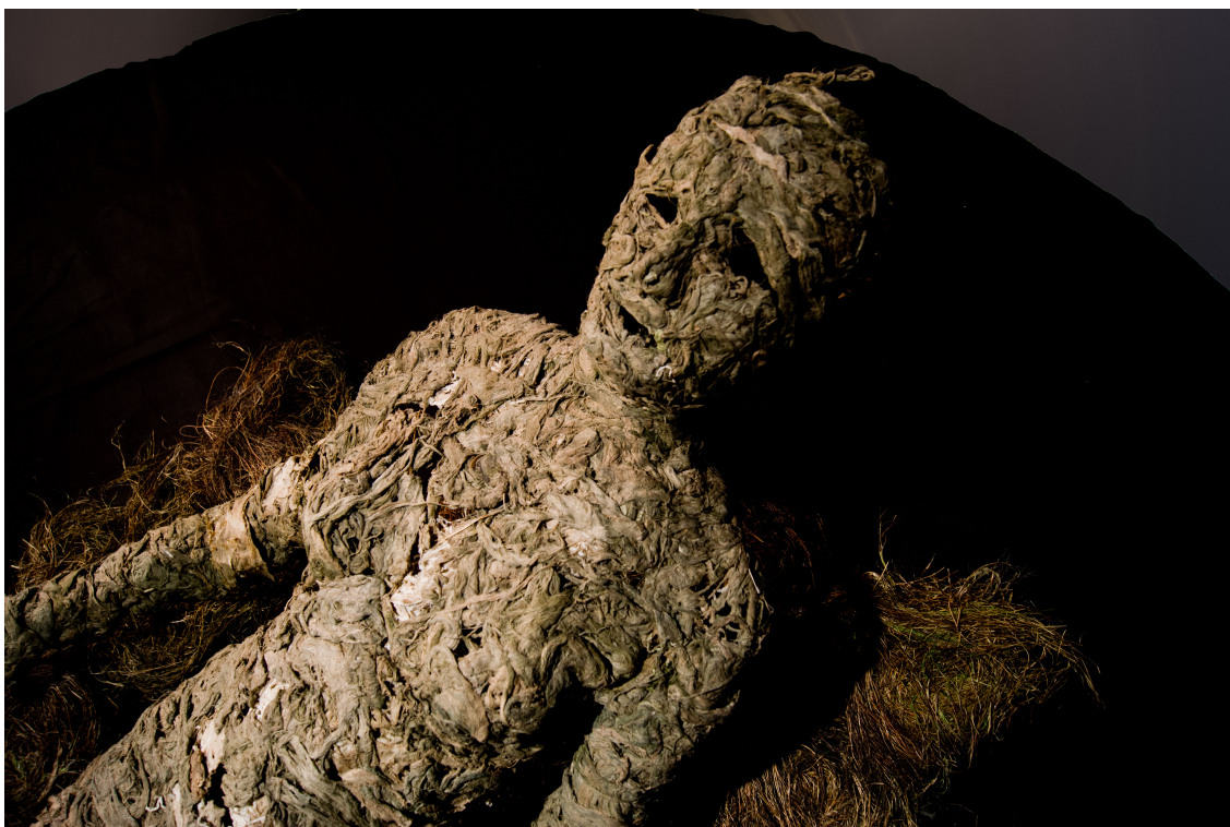
Yksityiskohta päättötyöstäni "Maan ja Taivaan Välillä" (2017) (teosmateriaali: merilevä)

Kestää pitempään kuin hurmiollinen ihastus. Suhteen, jossa kumpikin voivat näyttää haavansa mitään häpeilemättä. Mikä on haavemaailmaa, ja mikä on todellisuuden myöntämistä? Pyyteettömän rakkauden kuva. Herran rakkaus. Luovun elämän edessä siitä, mikä on minulle tärkeää, mikä tekee kipeää. Sydämeen kätkeytyy arvokkain aarre.