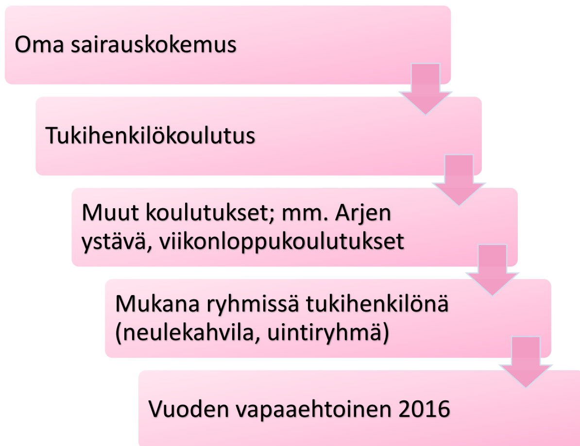
Kuvio 3. Esimerkki Satakunnan Syöpäyhdistyksen tukihenkilön urapolusta.