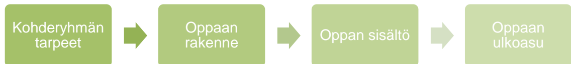
Kuva 2. Suunnitelma.

Opas toteutettiin teknisesti Power Point-ohjelmalla, jolloin se voidaan tulostaa tarvittaessa vihkomuotoon. Ohjelman avulla pystyttiin luomaan oppaalle kiinnostusta herättävä ulkoasu ja opasta kuvitettiin valokuvilla, joiden käyttöön on kysytty lupa kuvien ottajilta. Suurin osa valokuvista on otettu tekijän omalta tallilta ja omista hevosista. Kuvat on otettu niin, että niissä esiintyviä henkilöitä ei voida tunnistaa. Kuvissa olevilta ihmisiltä on lisäksi kysytty lupa kuvien käyttöön. Tällä tavoin yksityisyyden suoja säilyy eikä kirjallisia lupia kuvien käyttöön tarvita.