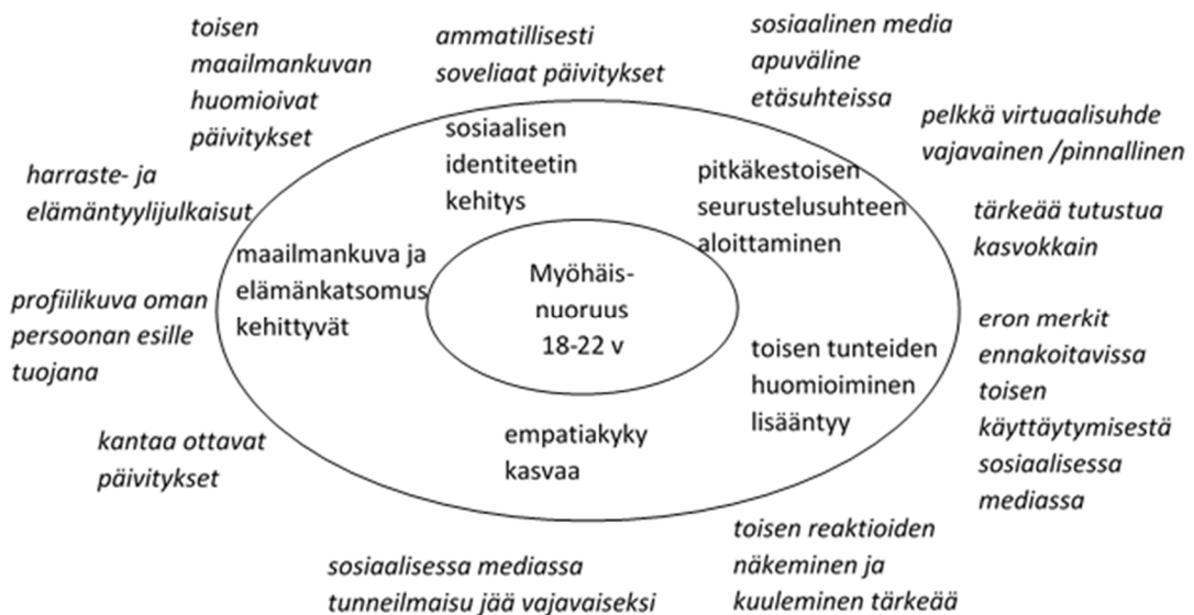
Kuva 3. Myöhäisnuoruuden sosiaalisia ja psykologisia kehitystehtäviä (sisäkehällä) ja myöhäisnuorten ryhmän keskeisimmät abstrahoidut tulokset (kehän ulkopuolella kursivoilla)

Kuvassa 3 on esitetty myöhäisnuoruuden sosiaalisia ja psykologisia kehitystehtäviä ja keskinuorten ryhmästä saadut keskeisimmät abstrahoidut tulokset.