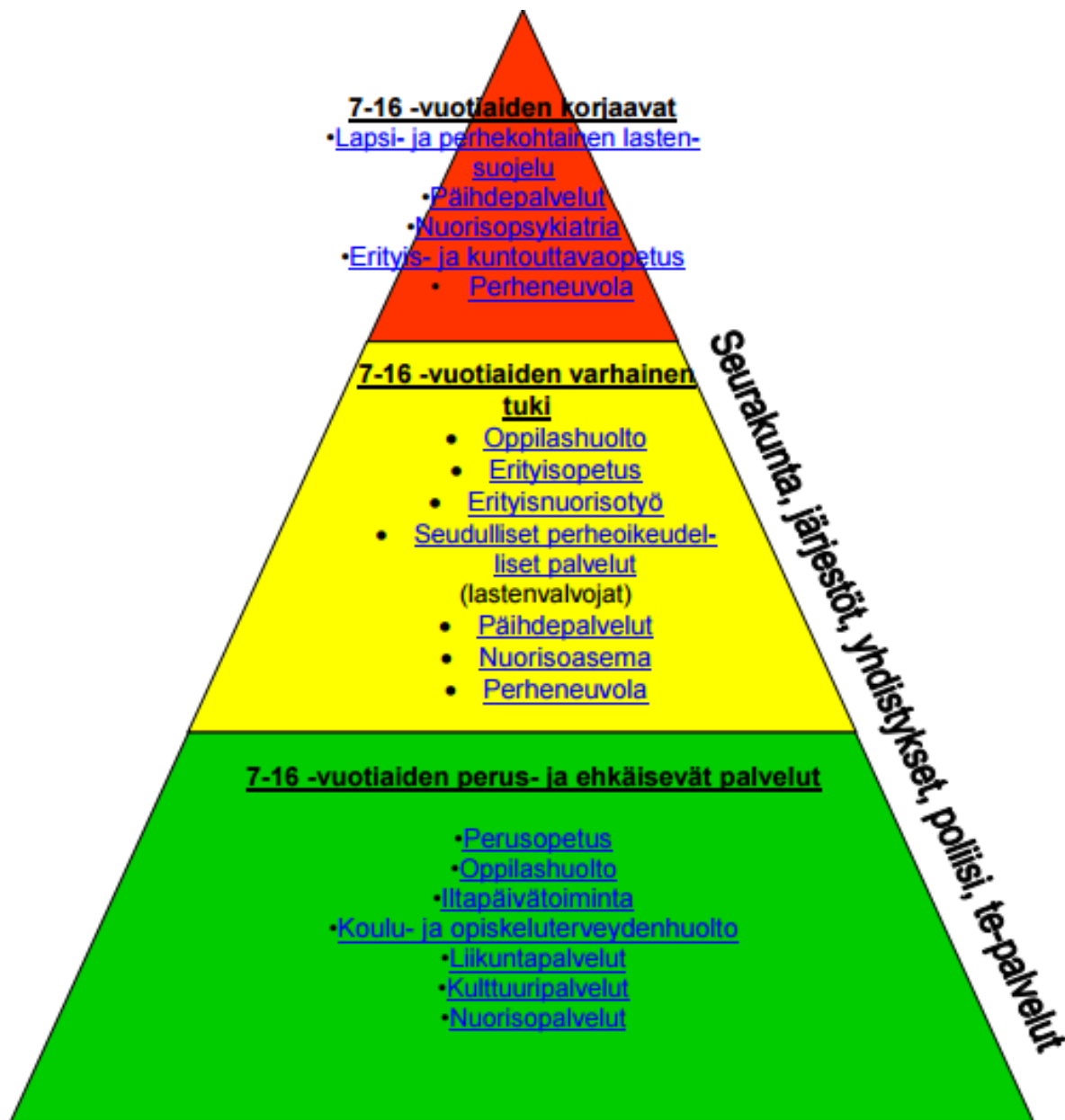
KUVIO 1. Ehkäisevät, varhaiseen tukeen liittyvät ja korjaavat palvelut Hyvinkäällä 7–16-vuotaille (Lasten ja nuorten hyvinvointisuunnitelma 2014-2017.)

vuotiaisiin, halusin myös kuvioiden avulla näyttää, mitä syrjäytymistä ehkäiseviä palveluita Hyvinkään kaupunki tarjoaa vielä nuoremmille.