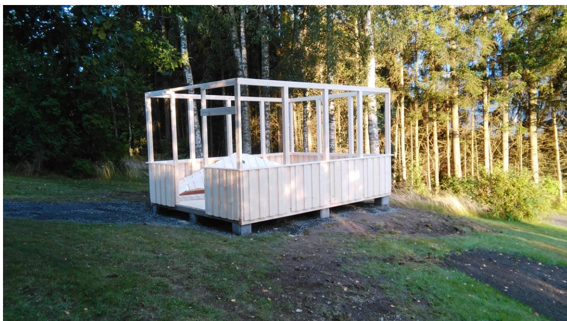
KUVA 4. Ensimmäisen illan aikaansaannos.

Talkooväistä vastasi ensimmäisenä iltana Luvian kesäteatterilaiset, tarjolla oli makkaraa ja mehua sekä kahvia ja keksejä.