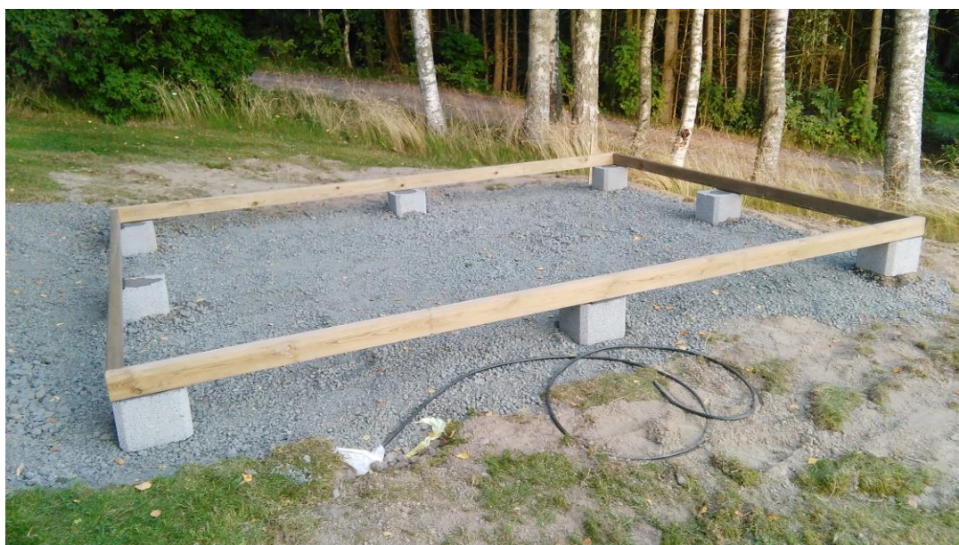
KUVA 2. Perustukset valmiina.

Tämän jälkeen oli vielä maalit hankittavana ja muutaman puhelun jälkeen saimme maalit lahjoituksena eräästä nimettömänä pysyvästä maalikaupasta. Kaikki hankinnat oli valmiina ja auton nokka kohti Luviaa. Seuraavana vuorossa oli yhteistyökumppani RACMA Oyn työntekijän tapaaminen katoksella ja perustusten tekeminen. Tiistaina illalla yksi osallistunut nuori kävi pesemässä katokselle tulevat terassipöydät ja tuolit toisen opinnäytetyön tekijän kotona missä niitä säilytettiin.