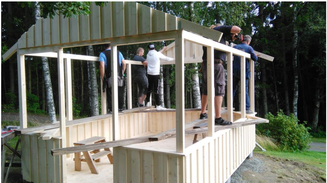
KUVA 5. Rakentamista.

Tilanteesta selvittiin hyvin kun osa nuorista kävi vain katsomassa mitä katoksella oikein tapahtuu ja osa jäi paikalle joko katsomaan tai talkoisiin. Talkoissa oli mukava ja leppoisa tunnelma. Nuorilla oli selkeästi hyvä olla, kun he tulivat iloisesti paikalle ja tarttuivat reippaasti työhön. Tilanne oli erilainen kuin esimerkiksi perinteinen ilta nuorisotalolla, säännöt olivat vähän löyhemmät, sillä vieraina ihmisinä emme voineet kieltää energiajuomia tai nuorten tupakointia. Tupakoinnista sanottiin että nuorisotalon alueella ei polteta, se oli kiellettyä.