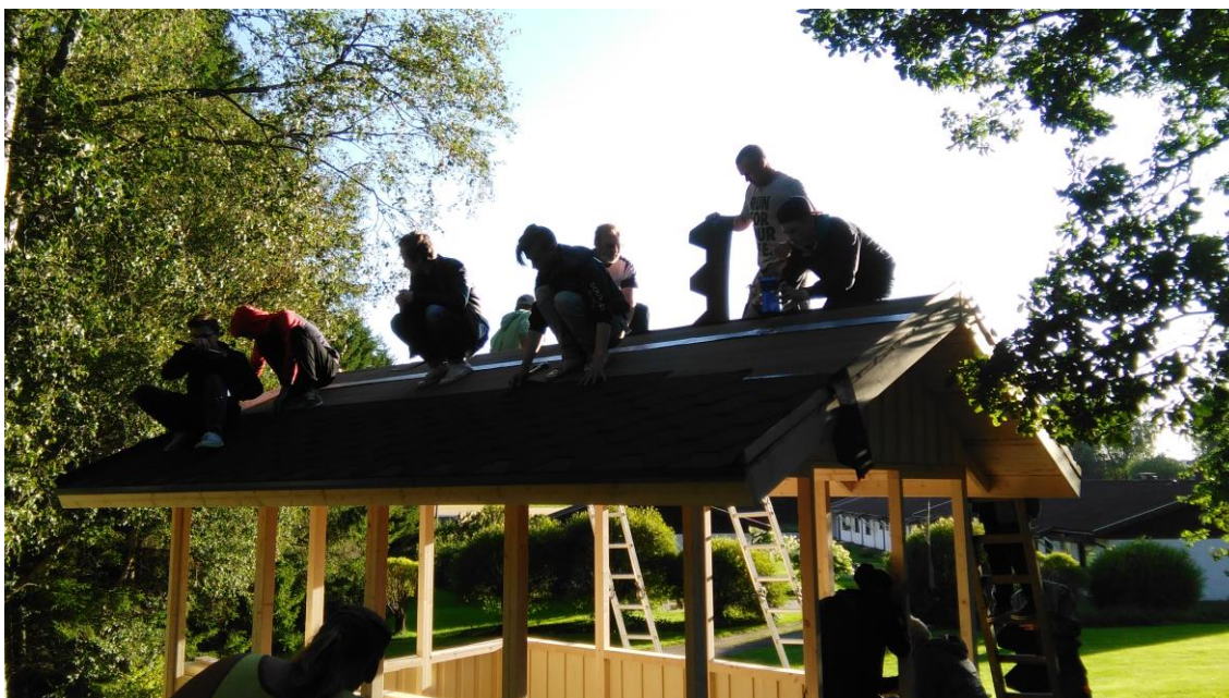
KUVA 6. Loppusilausta vaille valmis katos.

Talkooväistä huolehti perjantaina Luvian Martat ry, he olivat leiponeet sämpylöitä ja lisäksi oli makkaraa.