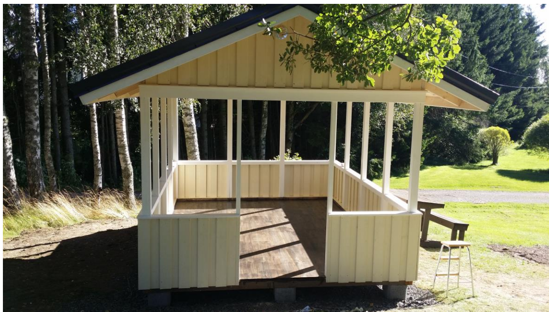
KUVA 7. Valmis katos.

Muut aktiiviset maalaajat koostuivat aikuisjäsenistä, Luvian MLL:n jäsenistä sekä nuorten vanhemmista. Talkooväiksi haettiin lauantaina läheisestä pizzariasta pizzat. Aikaa maalaamiseen kului muutama tunti ja lopuksi kannoimme sisälle vielä lahjoituksena saadut terassipöydät ja tuolit.