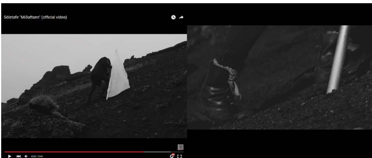
Kuva 2. Vasemmalta oikealle liikkumissuunta (Solstafir Midaftann official video 2015)

Kuvan 1 vasemmanpuoleisessa osassa videon päähenkilö liikkuu oikealta vasemmalle ja oikeanpuoleisessa kuvassa vasemmalta oikealle. Eriävä liikkumissuunta vastaa protagonistin sekavaa tilaa sekä määränpään puuttumista. Parhaimmillaan tällä keinolla saadaan katsoja tuntemaan epäjärjestyttä ja epämukavia tuntemuksia. Tarinan käännekohtan jälkeen liikkumissuunta on vasemmalta oikealle, osoittaen sen, että protagonisti on oikealla tiellä, matkalla eteenpäin ja kohti pelastusta (KUVA 2). Tällä tavoin eritellyt kuvallisen ilmaisun tavat tukevat toinen toisiaan ja tekevät tarinan käännekohtasta voimakkaamman ja mielenkiintoisemman.