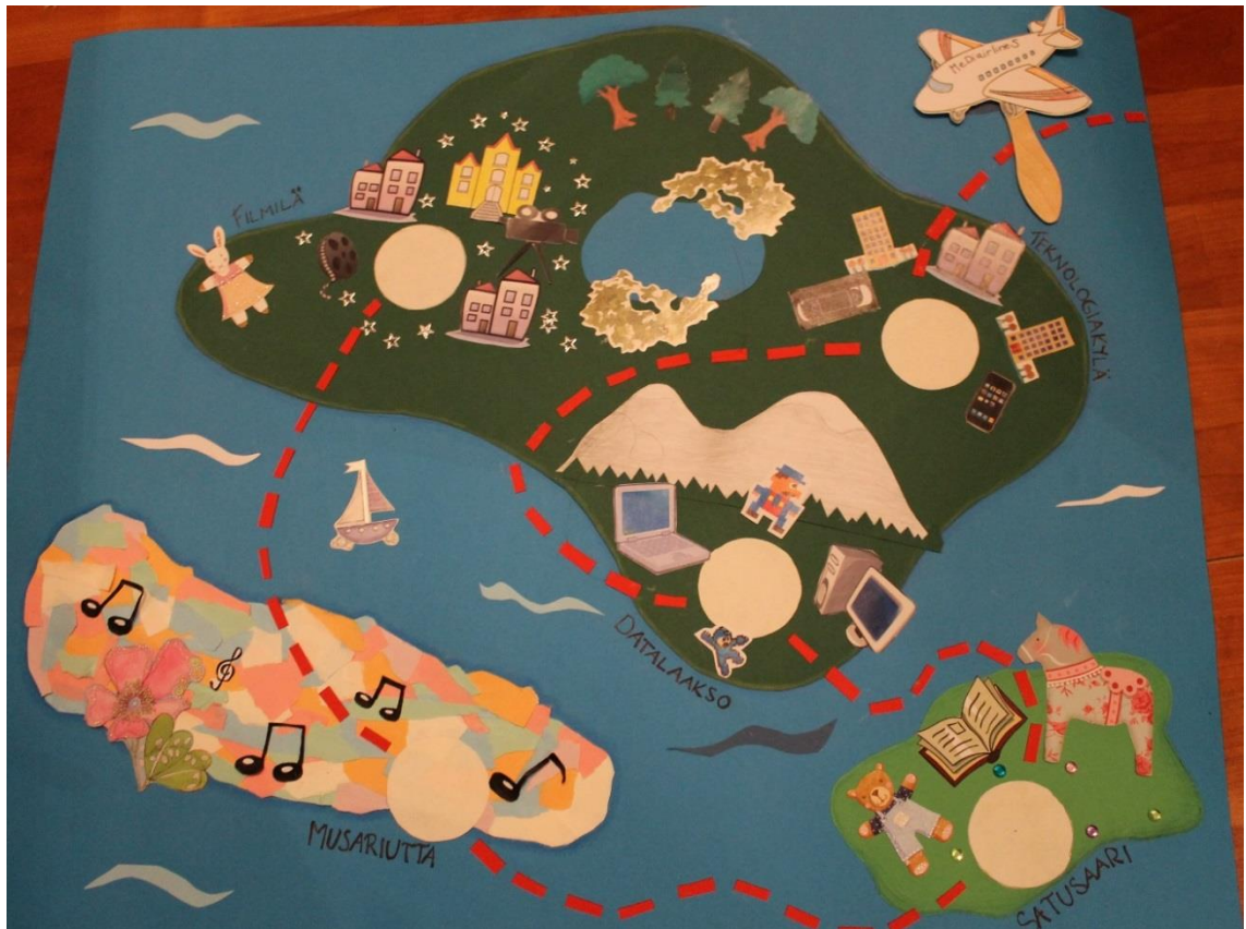
Kuva 1. Mediamailman kartta

Halusimme tehdä Mediamatkasta innostavan ja selkeän kokonaisuuden. Ajatuksena oli, että toteutamme lasten kanssa yhteisen matkan, jonka aikana vierailemme kaikissa kohteissa ja opettelemme erilaisia taitoja. Loimme Mediamailman kartan ja MediAirlines-lentokoneen, jolla matkustimme kartalla kohteesta toiseen. Kartta toimi havainnollistavana ja innostavana välineenä, auttoi meitä jäsentämään kokonaisuutta ja toi lapsille jatkuvuutta toimintaan. Joka toimintakerran alussa ”lensimme” uuteen kohteeseen ja lennon aikana lauloimme keksimämme Mediamatkalaulun. Teimme lisäksi ”matkalle” virittävän esittelyvideon, jonka näytimme lapsille. Videolla esittelimme itsemme mediamatkaoppaina ja kerroimme matkamme sisällön. Lapset saivat matkan aluksi mediamatkapassit, joihin he saivat jokaisen toimintatuokion lopuksi leimat muistoksi mukana olost. Jokaisen toimintakerran lopuksi lapset antoivat palautetta toiminnasta askartelemillamme peliaiheisilla palautetikuilla.