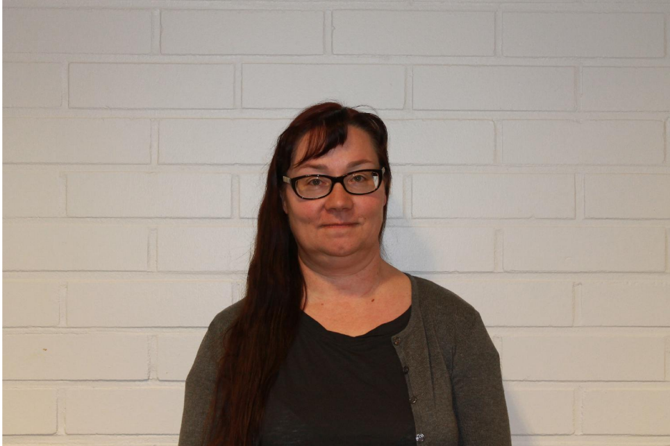
KUVA 2. Diakoniatyöntekijällä ei ole diakoniatyöntekijän virka-asua päällä