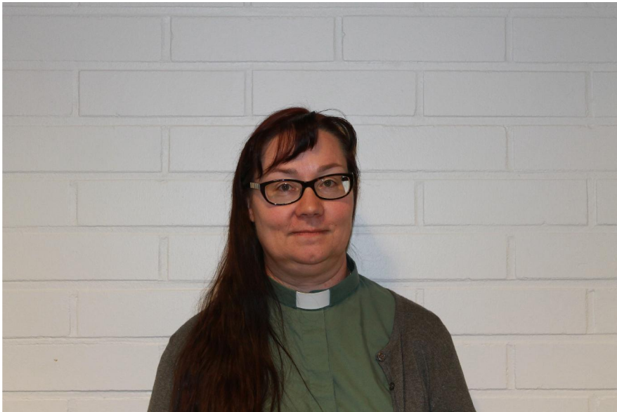
KUVA 1. Diakoniatyöntekijällä on diakoniatyöntekijän virka-asu päällä

4. Tässä kohdassa on edelleen samat kuvat kuin edellisessä kysymyksessä, mutta nyt kysymys koskee luotettavuutta. Kumpi henkilö on mielestänne LUOTETTAVAMPI? Laittakaa rasti ruutuun JOMMAN KUMMAN kuvan alle.