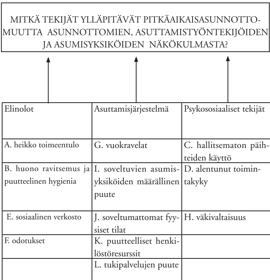
KUVIO 2. Pitkääikaissunnottomuutta ylläpitävät tekijät