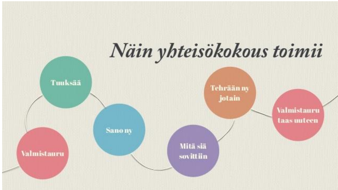
Kuva 1. Yhteisökokous 2.0 (Tuovinen, Hoivala, Pulkkinen & Korpinen 2014)

(kuva 1) on asukkaiden, heidän läheistensä ja muiden tehostetun palveluasumisen sidosryhmien yhteinen foorumi. Yhteisökokouksen on tarkoitus mahdollistaa osallisuutta ja antaa vaikutusmahdollisuuksia arjen isompiin ja pienempiin asioihin. (Innokylä 2014.)