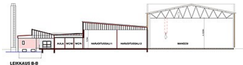
Kuva 1. Sorin Sirkuksen tilojen poikkileikkauskuva (aula, kahvila, harjoitussalit, maneesi/katsomo. Piirros Arkkitehtikonttori Petri Pussinen Oy. (Sorin Sirkus 2015).

Sorin Sirkus on vuosien varrella toiminut eri tiloissa. Toiminnan laajentuessa myös tilan tarve kasvoi. Nykyisissä Sorin Sirkuksen tiloissa Nekalassa on iso ja korkea harjoitustila, maneesi, joka on muunneltavissa 450-paikkaiseksi siirtokatsomoksi. Se on tarpeen, sillä Sorin Sirkuksen Joulushow kerää vuosittain jopa 10 000 katsojaa. (Sorin Sirkus). Maneesin lisäksi on useita pienempiä harjoitussaleja, väline- ja rekvisiittavarastot ja tekniikkatila, jossa voidaan korjata ja valmistaa välineitä ja rekvisiittaa. Sirkuksella on käytössään myös nykyaikainen ääni-, valo-ym. tekniikka. Sirkuksen sydämenä toimii aulan yhteydessä oleva kahvila, joka toimii vapaaehtoisvoimin. Se on kohtaamispaikka eri-ikäisille sirkuslaisille ja heidän vanhemmilleen, kun toiset vanhemmat tuovat ja toiset hakevat lapsiaan.