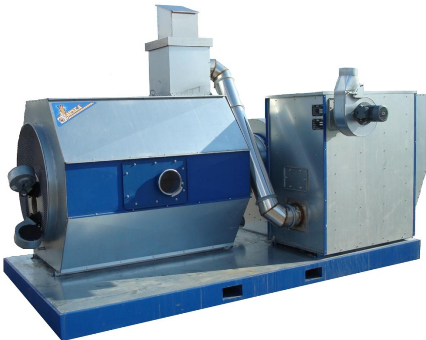
Kuva 2. Etu-uuni (Araska-metalli 2013)

Etu-uunissa on kiinteälle polttoaineelle soveltuva poltin ja tulipesä (kuva 2). Etu-uuni sijoitetaan tavallisen öljyuunin etupuolelle, josta pakokaasut johdetaan suoraan öljyuunin poltinaukkoon. Vanhaa öljyuunia käytetään tässä tapauksessa lämmönvaihtimena (Araska-metalli 2013).