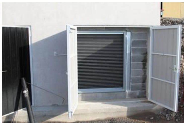
Kuva 4. Radiaattori, jonka läpi ilma johdetaan kuivurin koneistoon. (Antiteollisuus 2013.)