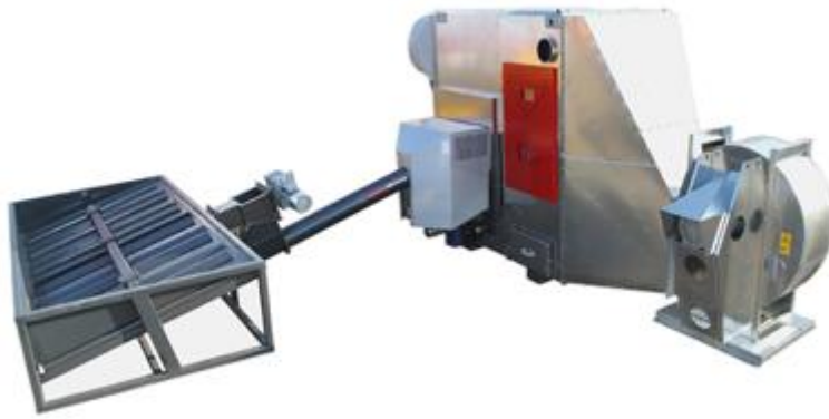
Kuva 1. Ilmauuni (Antiteollisuus 2013)

Etu-uunissa on kiinteälle polttoaineelle soveltuva poltin ja tulipesä (kuva 2). Etu-uuni sijoitetaan tavallisen öljyuunin etupuolelle, josta pakokaasut johdetaan suoraan öljyuunin poltinaukkoon. Vanhaa öljyuunia käytetään tässä tapauksessa lämmönvaihtimena (Araska-metalli 2013).