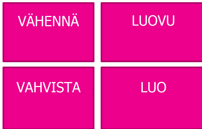
KUVIO 4. Sinisen meren strategia (Innokylä 2015.)

Toiminnan kehittäminen on mahdollista sinisen meren strategian mukaan (kuvio 4). Vapaaehtoistoiminnassa tulisi vahvistaa edelleen ryhmähenkeä ja osallisuutta. Vapaaehtoisten yhteisöllisyyttä voisi tukea esimerkiksi luovalla toiminnalla tai tarjoamalla yhteisiä harrastemahdollisuuksia Ilvola-Säätiön tiloissa. Tukevan pohjan luominen vapaaehtoisille vahvistaa sitoutumista. Uuden rahoituksen myötä vapaaehtoistyön toimintaa voidaan kehittää ja rekrytoida uusia ihmisiä mukaan toimintaan.