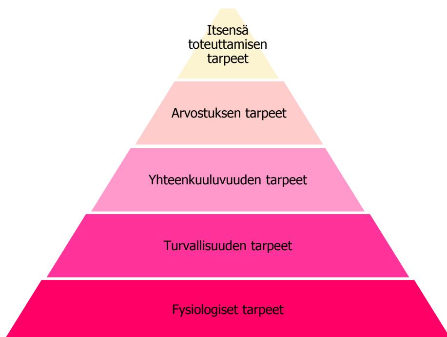
KUVIO 1. Maslowin tarvehierarkia (Kremer ja Hammond 2013.)

Räihän ym. artikkelissa kirjoitetaan, että vapaaehtoistyö voidaan rinnastaa Maslowin tarvehierarkian ylimmän tason, eli itsensä toteuttamisen tarpeen tyydyttämiseen. Vapaaehtoistyöhön osallistuminen on kiinteästi yhteydessä myös yksilön arvomaailmaan, eli siihen mihin kukin uskoo tai mitä hän pitää oikeana. Motivaatio syntyy myös altruistisesta (ensisijaisesti muita, kuin itse hyödyttävä toiminta) auttamisen halusta, mutta myös toisaalta halusta saada itselleen toimintaa. Vapaaehtoisuuteen liittyvissä asenteissa korostuvat siis myös yksilölliset eli subjektiiviset motiivit. (Räihä ym. 2012, 225–227.) Kun vapaaehtoistyöntekijä on motivoitunut, hänen arvomaailmansa kohtaa vapaaehtoistoiminnan arvomaailman, on hänen sitoutumisensa mukaan toimintaan voimakkaampaa.