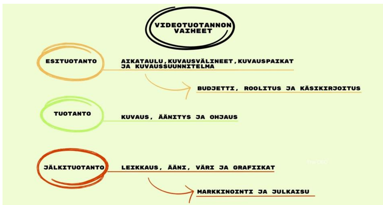
Taulukko 1. Videotuotannon vaiheet (Niemi 2024)