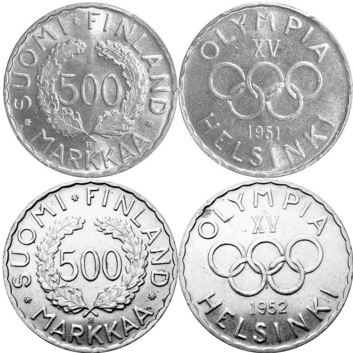
Kuva 1. 500 markkaa 1951 ja 1952.

Ajan oloon rahasta tuli kuitenkin keräilijöiden suosikki niin Suomessa kuin ulkomailla, ja erityisesti vuoden 1951 rahat nousivat arvossaan. Jopa tavallinen vuoden 1952 olympiaraha talletettiin mieluummin piirongin laatikkoon kuluttamisen sijaan, ja tämän vuoksi ei vuoden 1952 olympiaraha ole juuri koskaan ollut mitenkään erityisen arvokas.