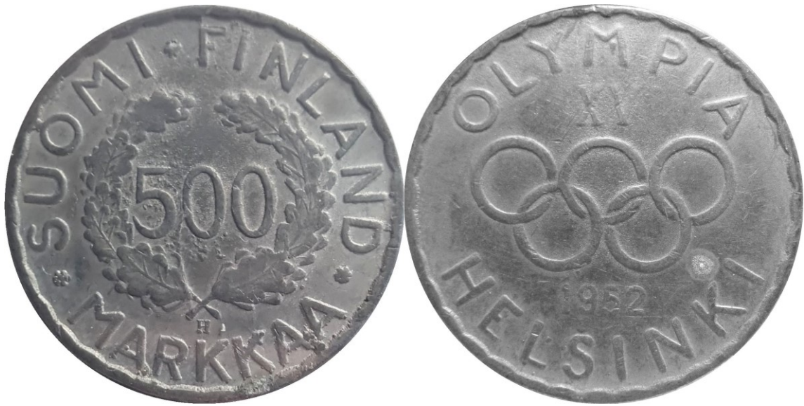
Kuva 2. 500 markkaa 1952, valettu väärennös. Kuvat Jani Nuorala, kuvien muokkaus ja yhdistely Jorma J. Imppola, SeAMK.

Maaliskuussa 2024 löysi Jani Nuorala erään huutokauppatoimeksiantajansa kohteiden joukosta perin mielenkiintoisen vuoden 1952 olympiarahan – sehän oli väärennös!