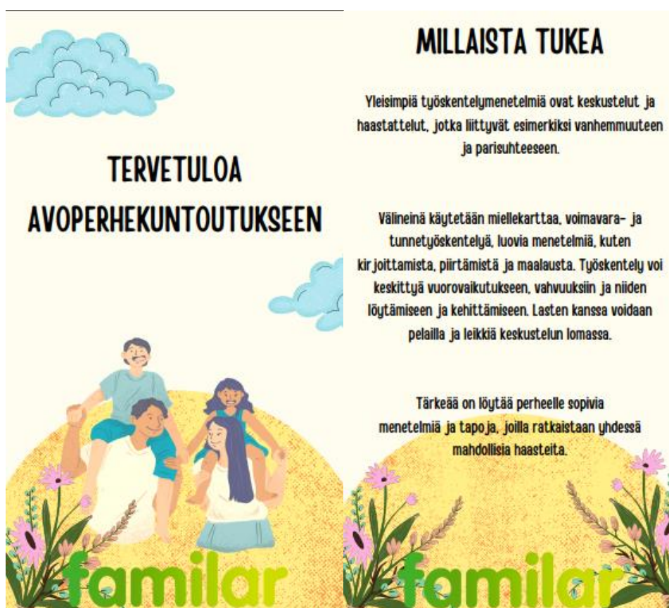
Kuva 1. Oppaan kansisivu.

Valitsimme oppaaseen Canva-malleista tarkoitukseen sopivan ja houkuttelevan pohjan, jota muokkasimme mieleisemmäksi (kuva 1). Aluksi oppaassa kerromme perustietoja avoperhekuntoutuksesta, asunnoista ja arjen jatkumisesta kuntoutuksen aikana.