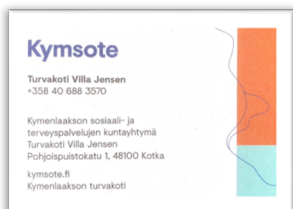
Kuva 4 Turvakoti Villa Jensenin käyntikortti

Kuvan 4 esite on käyntikortti, jossa ei avata lainkaan turvakodin palveluita, vaan siinä on vain Turvakodin yhteystiedot.