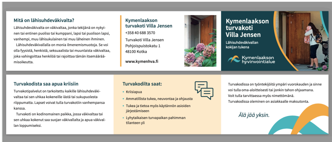
Valmis tuote, Turvakoti Villa Jensenin uudistettu esite