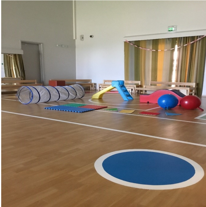
Kuva 1. Lapsen rakentama jumpparata