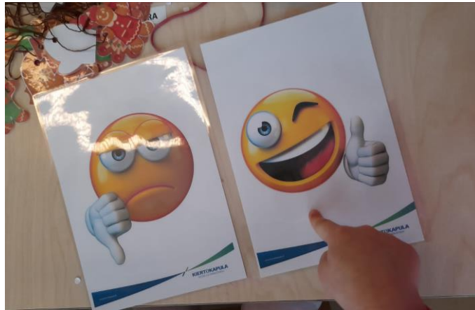
Kuva 4: Lasten yksilöhaastattelu kuvakorttien avulla.

Kaikki lapset valitsivat iloisen emojin ja ilmaisivat pitäneensä toiminnasta todella paljon. Moni lapsi totesi, että olisi mukavaa, jos tämänkaltaista toimintaa tehtäisiin myös tulevaisuudessa. Alle kerättiin myös lasten omia kommentteja, joita he sanoivat toiminnan aikana. Lasten spontaanit kommentit toiminnasta ilman haastattelu asetelmaa tuovat rehellistä ja aitoa näkökulmaa palautteen keruu vaiheeseen.