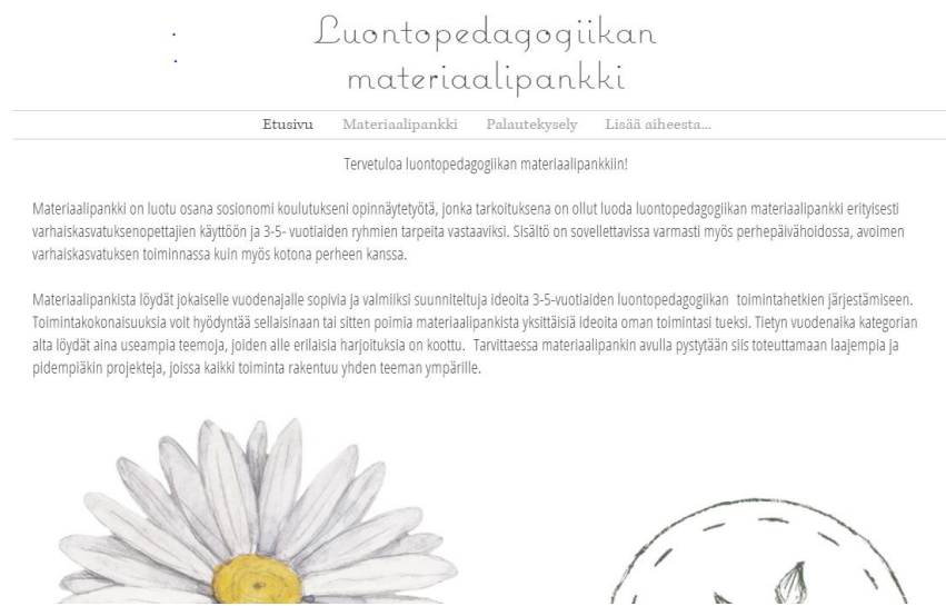
Kuva 6: Luontopedagogiikan materiaalipankin etusivu