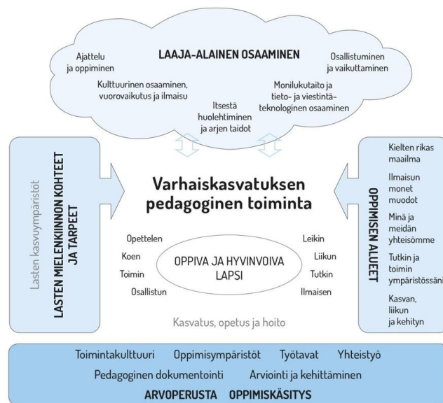
Kuva 1: Varhaiskasvatuksen pedagoginen viitekehys (Varhaiskasvatuksensuunnitelman perusteet 2018, 36.)

Varhaiskasvatussuunnitelman perusteisiin (2018) on kirjattu muun muassa kaikki ne tekijät, jotka mahdollistavat yhtenäisen, tasa-arvoisen varhaiskasvatuksen jokaiselle lapselle. Varhaiskasvatuksen pedagogista toimintaa ohjaa vahvasti varhaiskasvatussuunnitelmasta (2018) löytyvä pedagoginen viitekehys, joka kuvaa monipuolisesti pedagogisen toiminnan sisältöä. Pedagogista toimintaa ohjaavat: varhaiskasvatuksen arvoperusta ja oppimiskäsitys, lasten mielenkiinnon kohteet ja tarpeet, sekä oppimisen alueet ja laaja-alaisen osaamisen tavoitteet. (Opetushallitus 2018.)