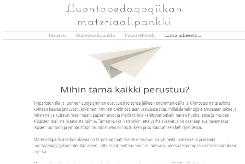
Kuva 8: Luontopedagogiikan materiaalipankin lisää aiheesta - osio.

Anonyymiin palautekyselyyn (Kuva 9) on koottu yhteensä 3 pää kysymystä, joista kohta 2 sisälsi useamman tarkentavan kysymyksen materiaalipankin käyttökokemuksista. Alla listattuna lopulliset materiaalipankissa julkaistut palautekyselyn kysymykset.