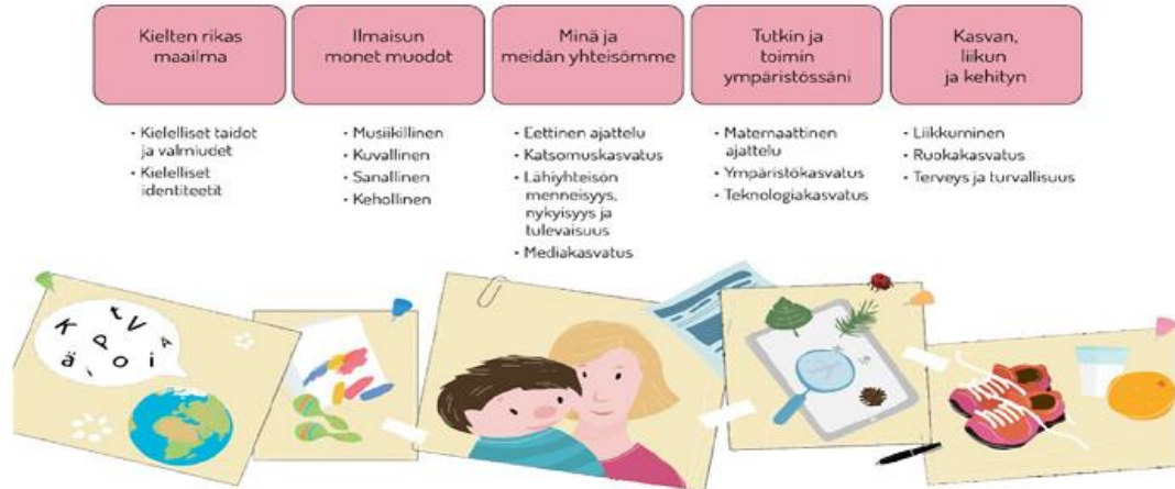
Kuva 2: Varhaiskasvatussuunnitelman oppimisen osa-alueet