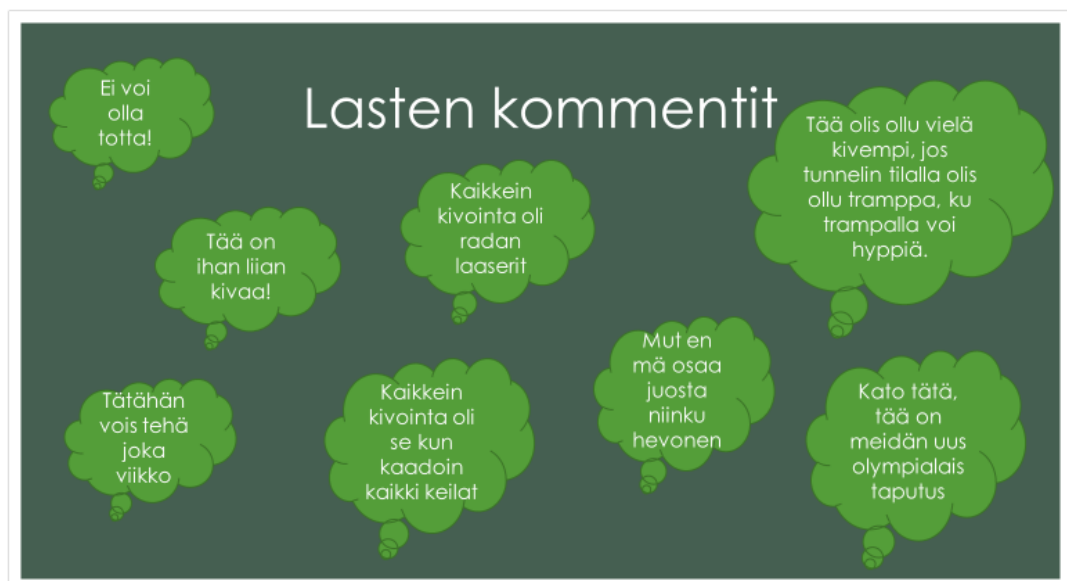
Kuva: 5 Lasten kommentit toimintakokonaisuuden testivaiheesta.

Kaikki lapset valitsivat iloisen emojin ja ilmaisivat pitäneensä toiminnasta todella paljon. Moni lapsi totesi, että olisi mukavaa, jos tämänkaltaista toimintaa tehtäisiin myös tulevaisuudessa. Alle kerättiin myös lasten omia kommentteja, joita he sanoivat toiminnan aikana. Lasten spontaanit kommentit toiminnasta ilman haastattelu asetelmaa tuovat rehellistä ja aitoa näkökulmaa palautteen keruu vaiheeseen.