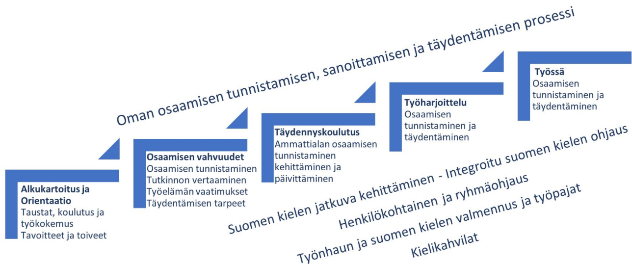
KUVIO 1. Suomen kielen integrointi SIMHE-polun osaamisen tunnistamisen, sanoittamisen ja täydentämisen prosessissa

SIMHE-polussa S2-integrointi oli eri toimiin linkittyvää suomen kielen oppimista ja ohjausta. Polkuun osallistujat kehittivät oman ammattialan osaamisensa tunnistamista ja sanoittamista jatkumona. Suomen kieltä ei opeteta erillisillä kursseilla, vaan kielitaidon kehittämistä tuettiin oikea-aikaisella ohjauksella. S2-integrointi ja SIMHE-polun osaamisen tunnistamisen, sanoittamisen ja täydentämisen prosessin eri vaiheet on esitetty kuviossa 1. Alkukartoituksen pohjalta laaditaan henkilökohtainen täydennyskoulutussuunnitelma, johon valitaan opintoja ja toimia hakijan tarpeen mukaan. Täydennyskoulutus voi sisältää työharjoittelun. Koulutusta ja työllistymistä tuetaan henkilökohtaisella ja ryhmäohjauksella.