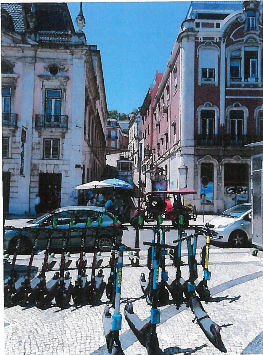
Mäkiä riittää Lissabonissa.

USA:ssa ei ehkä virallisesti tunnusteta ilmastonmuutosta, mutta NASA kuitenkin varautuu pahan päivän varalle. Digitaalista Nooan Arkkia (DNA-arkki) testataan parhaillaan kansainvälisellä avaruusasemalla. Write Once Read Forever (WORF) -tallennusmenetelmän ei pitäisi olla herkkä avaruuden