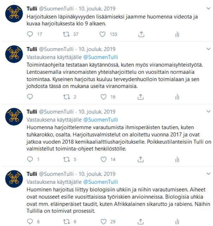
Kuva 3. Tullin twiitit ennen harjoitusta.

Sosiaalisessa mediassa käyty keskustelu herätti paljon huomiota, trollaamista ja viranomaisten kyseenalaistamista. Toimenpiteenä Tullin viestintä julkaisi virallisella twittertilillään tietoa, jonka tarkoituksena oli taustoittaa harjoituksen tarkoitusta ja tavoitteita sekä varmistaa harjoituksen läpinäkyvyys kertomalla julkaisevansa harjoituksesta reaaliaikaisia kuvia ja -videoita.