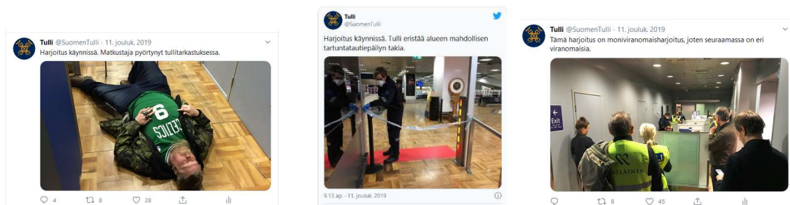
Kuva 4. Tullin julkaisemaa materiaali moniviranomaisharjoituksesta.

Tulli julkaisi ennen moniviranomaisharjoitusta kenttäjohtajan ja harjoituksessa tarttuvaa tautia sairastavaa matkustajaa esittävän henkilön haastattelut. Lisäksi Tulli julkaisi reaaliaikaisesti kuvia ja videoita harjoituksesta, jossa oli nähtävissä harjoituksen kulku ja osallistuvat viranomaiset ja pelastushenkilökunta.