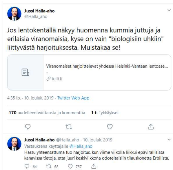
Kuva 2. Jussi Halla-ahon Twitter-tilin kommentointi viranomaisharjoituksesta.

Sosiaalisessa mediassa käyty keskustelu herätti paljon huomiota, trollaamista ja viranomaisten kyseenalaistamista. Toimenpiteenä Tullin viestintä julkaisi virallisella twittertilillään tietoa, jonka tarkoituksena oli taustoittaa harjoituksen tarkoitusta ja tavoitteita sekä varmistaa harjoituksen läpinäkyvyys kertomalla julkaisevansa harjoituksesta reaaliaikaisia kuvia ja -videoita.