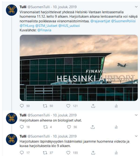
Kuva 2. Tullin Twitter-tilillä julkaistu tieto moniviranomaisharjoituksesta.

taa. Tiedotteessa kerrottiin myös, että harjoituksen aiheena on biologiset uhat. Tullin lisäksi mukana harjoituksessa olivat Rajavartiolaitos, poliisi, Terveysten ja hyvinvoinnin laitos, sosiaali- ja terveysministeriö, Helsingin Uudenmaan sairaanhoitopiiri, Vantaan kaupunki, Finavia sekä Liikenne- ja viestintävirasto. Sama tieto julkaistiin myös Tullin virallisella Twitter- ja Facebook-tilillä.