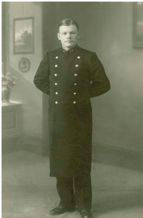
Syrtut på en konstapel i Åbo 1916.

moderiktiga rock i slutet av 1800-talet fick sitt namn från de franskspråkiga orden sur tout , som direkt översatt betyder “ovanpå allt”. På engelska heter fältoverallen coverall eller overall. När en ny poliskonstapel klär på sig uniformen tar hen samtidigt på sig sin egen yrkeskärs historia, eller åtminstone minnen och fragment av den. Samma återkommande dynamik av förändring och kontinuitet, som har präglat de gångna årtiondena, kommer att fungera även i fortsättningen, såväl i fråga om polisuniformen som i övrigt.