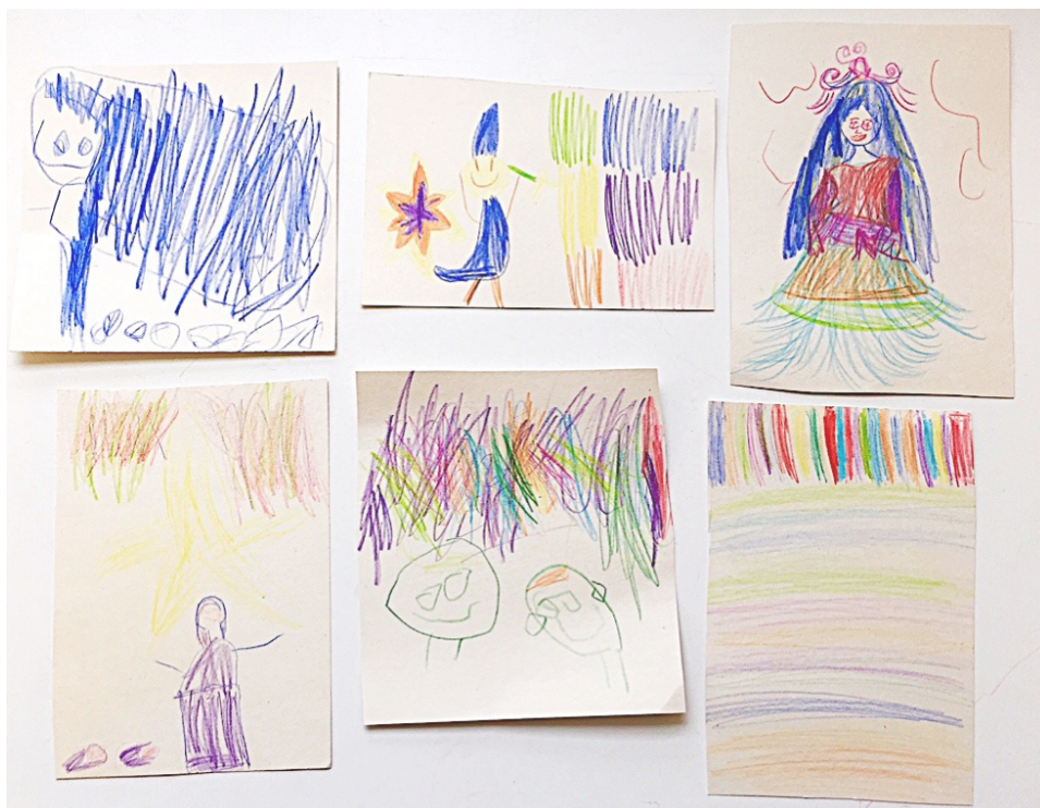
Kuva 13. Tarinoiden päähenkilöt 2.