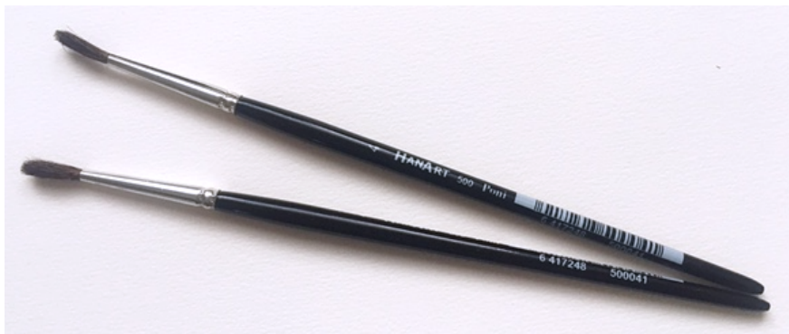
Kuva 1. HANART siveltimet (koko 4, poninkarva)

Opetuskokeilussa käytin HanArt –merkkisiä siveltimiä (kuva 1), jotka olivat kooltaan numero 4. Siveltimet ovat edullisia, mutta erittäin laadukkaita poninkarvasta tehtyjä pyörökärkisiveltimiä ja käyvät hyvin yleispätevään käyttöön eri värimateriaalien kanssa (vesi- ja pullovärit). Siveltimien koko 4 käy myös hyvin pikkutarkkaan työskentelyyn sekä suuremman pinta-alan maalaamiseen. Maalatessa on tärkeää myös se, että lapset saavat samanlaiset siveltimet. Siveltimien vertaileminen voi tuottaa häiriötä maalaustilanteeseen. Tämän välttääksemme on tärkeää, että kaikilla on samat materiaalit maalaustyön tekemiseen.