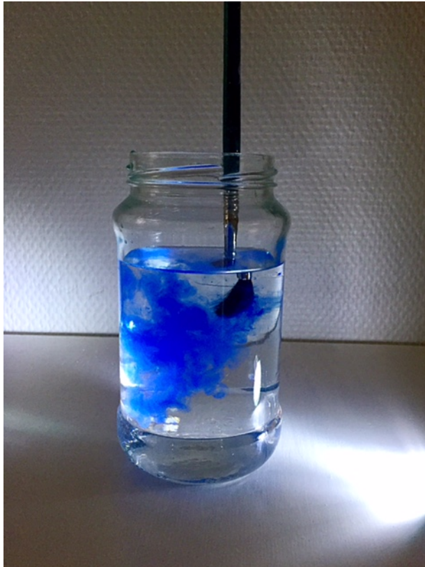
Kuva 2. ”Ja näin syntyi sininen...” –tarinan demo

Toisessa ryhmässä oli vain kuusi lasta paikalla, mutta silti alkuun lasten oli vaikea motivoitua tunnin kulkuun ja järjestäytymiseen meni paljon aikaa. ”Ja näin syntyi sininen” tarinalla oli tämänkin ryhmän kanssa kuitenkin rauhoittava ja pysäyttävä vaikutus, joka imaisi lasten huomion. Äänimaiseman luomisen kanssa oli ongelmia, kun omaa soittovuoroa ei haluttu odottaa ja tämän takia äänimaiseman tekeminen keskeytyi. Levottomuus saattoi johtua tilanteen jännittävyydestä ja uudenlaisuudesta.