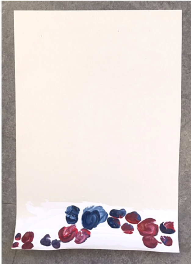
Kuva 10. Sommittelu alareunaan