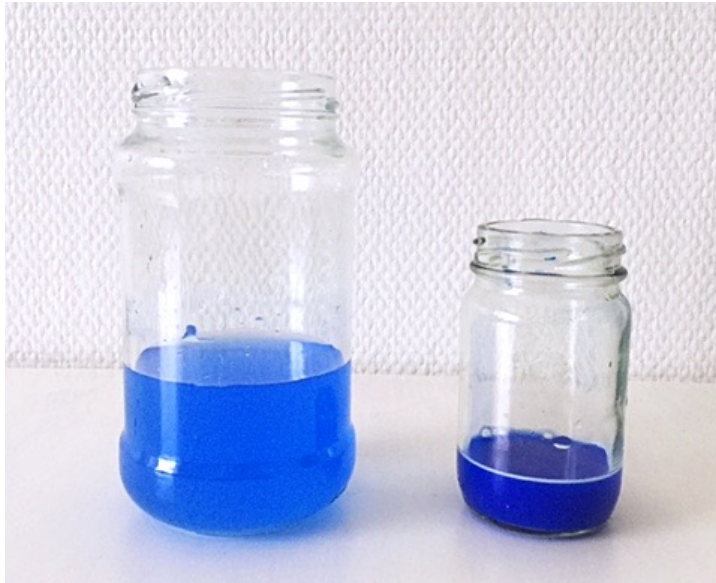
Kuva 3. Valmiiksi sävytetyt väripurkit

Tauon kuuleminen musiikista ja samalla maalaaminen integroi musiikki- ja taidekasvatusta yhtä aikaa. Lapset kiersivät pöytäryhmän ympärillä musiikin aikana ja pysähtyivät laveeraamaan kohdalle osunutta vesivärineliötä. Musiikin tauottamisella oli suuri merkitys, sillä lapsia huvitti, kun he saivat jatkaa kaverinsa maalausta. Haalean sävy oli lapsien mielestä liian vaaleaa eikä motivoinut maalaamaan (kuva 4). Toisen ryhmän kohdalla tummensin sävyjä, mutta silti kontrasti oli lasten mielestä liian suuri ja haalea väri liian haalea. Valitsin maalaamista varten valkoista vesiväripaperia, josta sävyjen olisi pitänyt erottua paremmin kuin ruskehtavasta maalauspaperista. Osa lapsista ymmärsi sävyjen eron tarkoituksen ja maalasivat haalealla sävyllä yhtä innokkaasti kuin tummalla. Testasin menetelmää kotona omilla akvarelliväreilläni, jotka olivat huomattavasti enemmän pigmentoituja kuin päiväkodissa olleet vesivärit. Värien laatu vaikuttaa merkittävästi kyseisen menetelmän onnistumiseen.