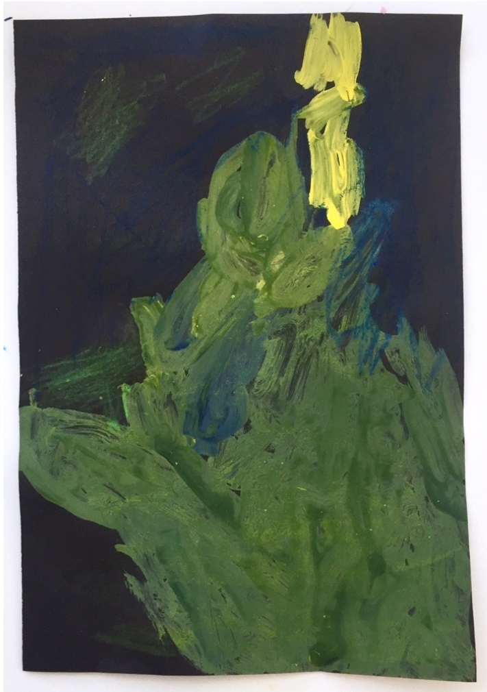
Kuva 7. Revontulimaalaus ja uudet vahaliiturevontulet

Jatkoimme uuteen aiheeseen ja teemaan, joka oli punainen ja oranssi. Tarina ”Ja näin syntyi punainen ja oranssi...” (liite 9) johdatteli lapset myöhemmin tehtävään maalaustyöhön ja esitteli jälleen värioppia. Taiteen perusopetuksen opetussuunnitelmassa (Taiteen perusopetuksen yleisen oppimäärän opetussuunnitelman perusteet 2017) toivottiin varhaisiänmusiikinopetukselta moniaistillisuutta ja muiden taideaineiden integrointia. Opinnäytteeni on täysin integraatiopainotteinen, mutta päätin ottaa myös moniaistillisuutta mukaan. Visuaalisia kokemuksia toteutettiin jo ensimmäisellä tunnilla tarinan demon yhteydessä (kuva 2) ja tällä kertaa suunnittelin tuntoaistia aktivoivan arvoituksen. Kukaan oppilas ojensi käden silmät kiinni ja annoin heille pumpulipallon käteen. Palloa tunnusteltiin silmät kiinni ja esitin muotoon ja väriin liittyviä kysymyksiä. Moni arvasi, että kyseessä oli pumpulipallo. Yksi veikkasi pallon väriksi punaisen, mutta yllätyin sen ollessa valkoinen.