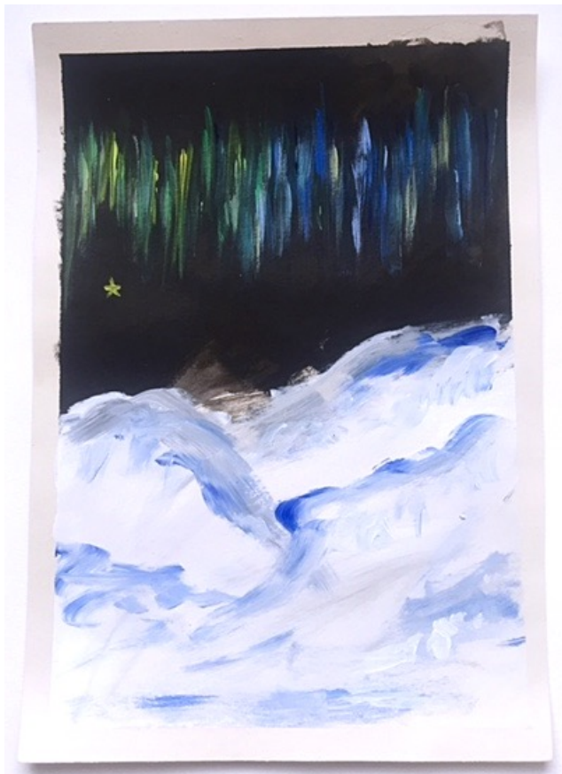
Kuva 5. "Ja näin syntyi vihreä..." kuvitus