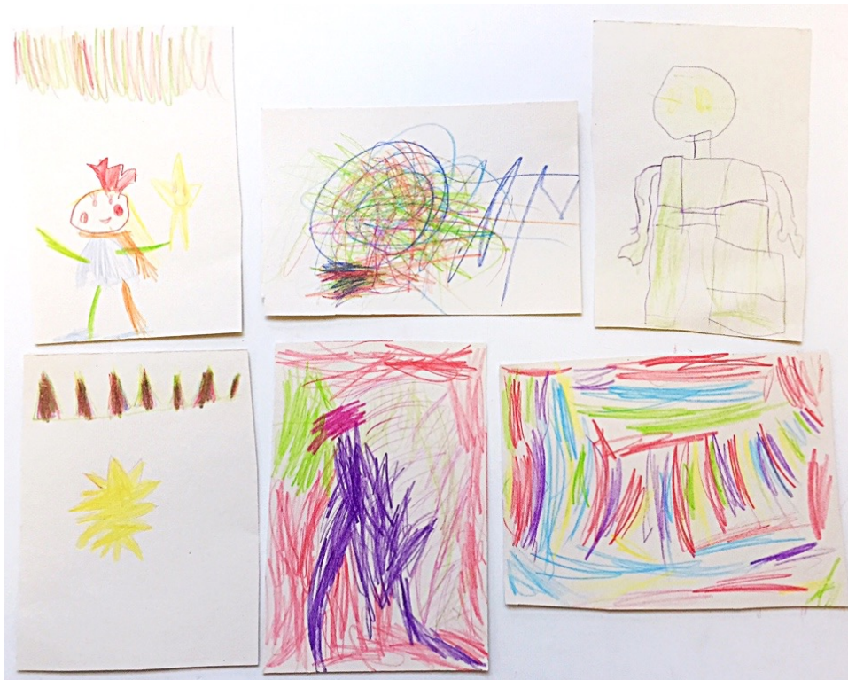
Kuva 12. Tarinoiden päähenkilöt 1.