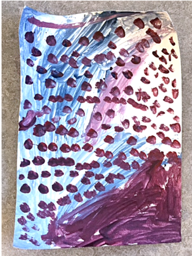
Kuva 12. Värisävyjen käyttäminen erikseen ja sekoitettuna

Rytmirinkulan kanssa harjoittelimme ensin yhteistä sykettä ja rinkulan pyörittelyä niin, että väri vaihtuivat. Tämän jälkeen rytmitimme omalle kohdalle osuneen värin ja muut toistivat rytmin perässä. Lapset keksivät hyvin monipuolisia variaatioita sävyjen sanarytmeistä ja kahden sävyn vaihteessa oleva oppilas keksi sisällyttää rytmiin molempien värien nimet. Toisen ryhmän kanssa tein selväksi, että jos rytmirinkulan kanssa villiinnytään, niin leikki loppuu saman tien kesken ja siirrymme muihin aktiviteetteihin. Hetken häiriköinnin jälkeen rytmittäminen onnistui kuitenkin tälläkin ryhmällä, kun oman rytmin keksiminen vaati keskittymistä ja rytmin toistaminen muiden rytmitysten kuuntelemista.