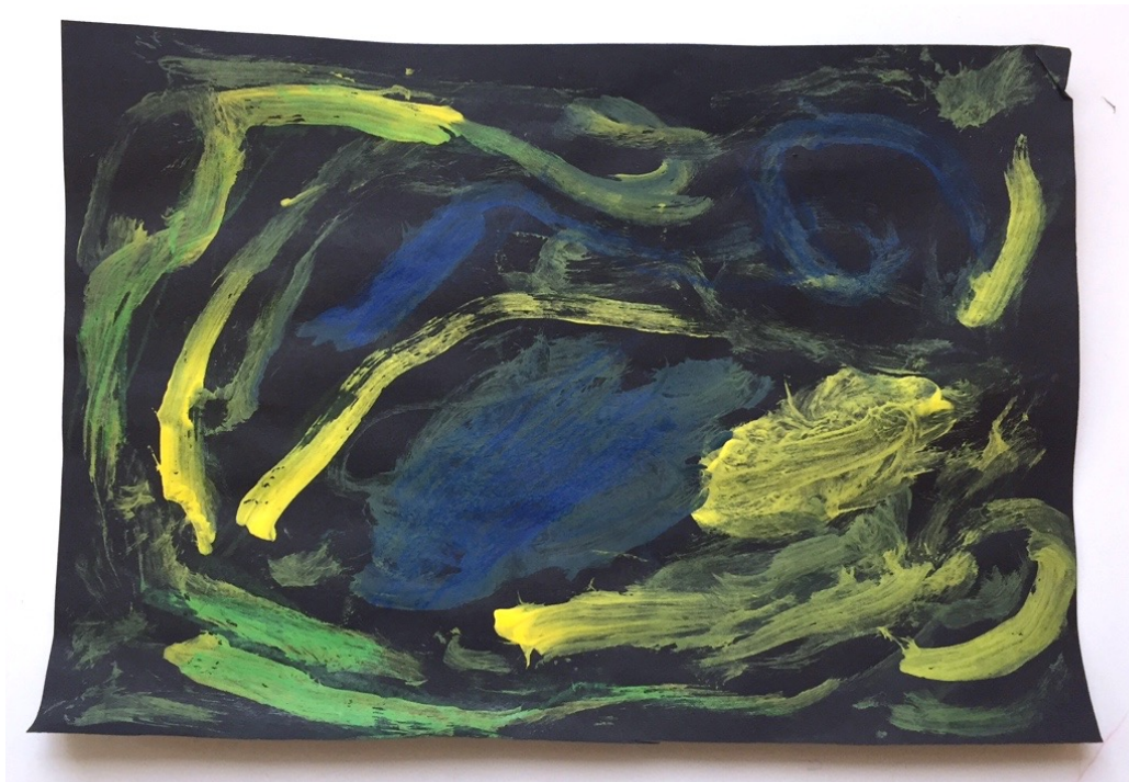
Kuva 6. Revontulimaalaus korostuksilla

Aloitimme tunnin tuttuun tapaan alkulaululla ja yksi oppilaista jo kyseli, että ”teemmekö taas sitä hauskaa kovaa ja hiljaa soittamista niiden kuvien kanssa?”. Tämän jälkeen viimeistelimme vahaliiduilla viime kerralla kesken jääneet revontulimaalaukset (kuva 6-7). Viime viikolla poissa olleille lapsille annoin mustaa paperia ja he tekivät pelkillä vahaliiduilla revontulimaalaukset. Kertasimme maalauksen aikana Revontulet Liehuu –kappaleen, jotta kappaleelle tulisi toistoa ja jäisi muistiin. Yllättävää oli, että osa lauloi kappaleen mukana keskittyneen piirtelyn ohessa. Kaikki halusivat korostaa viime viikon maalauksia, vaikka annoin lapsille vapauden valita, haluavatko he lisätä teokseen vahaliituja vai ei. Moni myös piirsi maalattujen revontulien viereen uudet revontulet vahaliiduilla.