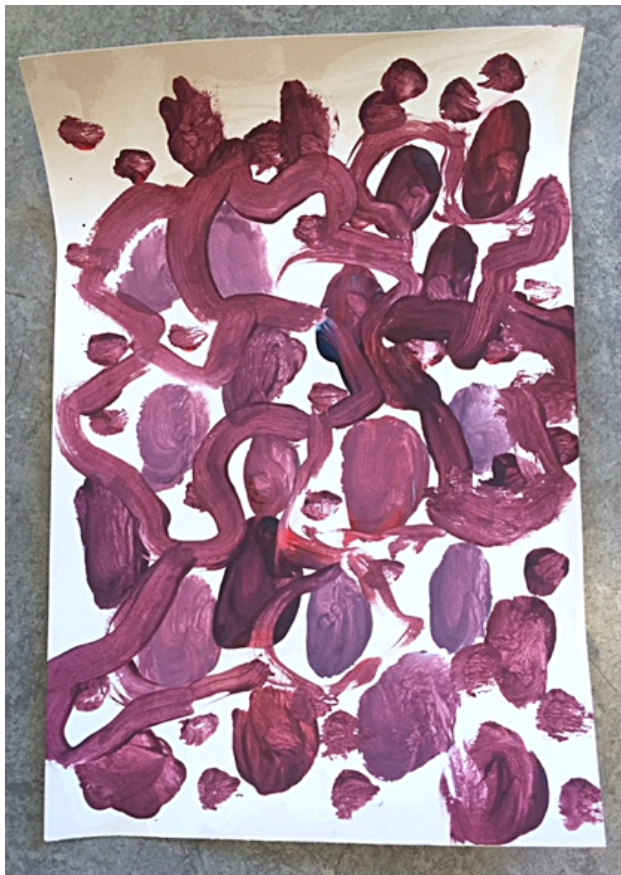
Kuva 11. Koko paperin käyttäminen sekoitetulla värillä