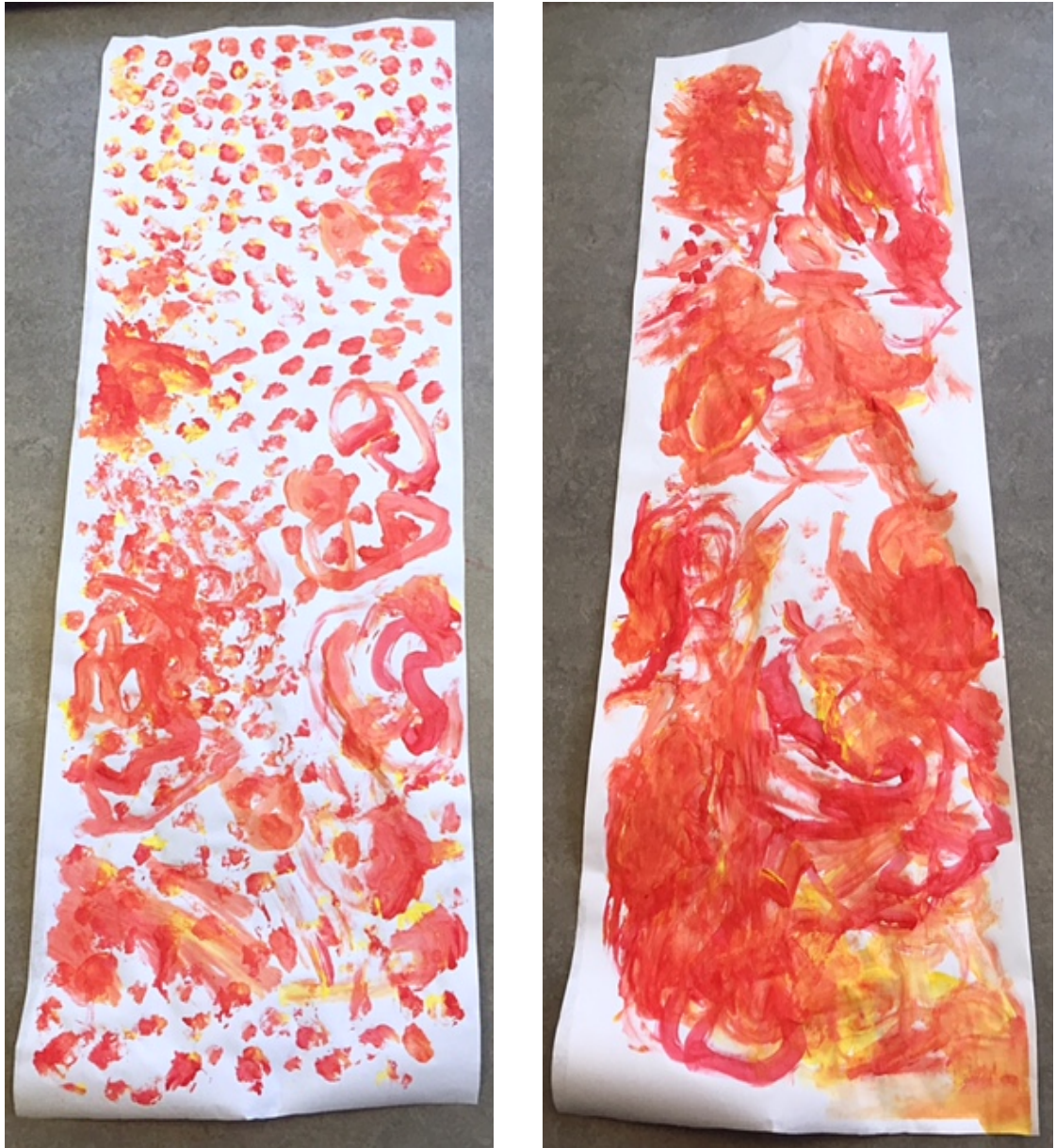
Kuva 8. Vasemmalla ensimmäisen ryhmän teos ja oikealla toisen

Maalaamisen jälkeen soitimme metallofoneilla ja agogoilla Maalauslaulua (Liite 3). Toin tunnille uudet rytmisoittimet, agogot, jotka naurattivat lapsia hassun muotonsa sekä nimensä takia ja niiden äänestä tuli mieleen lapsien mukaan kello. Agogojen kautta kuuntelimme, kumpi puoli soittimesta on matala ja kumpi korkea ääninen. Teimme saman myös metallofoneille, kun yksi oppilaista kysyi miksi metallofonit olivat merkitty sinisillä ja vihreillä merkeillä. Lapset tekivät huomion kuuntelun perusteella, että sävelet eivät ole samat vaan toinen on matalampi kuin toinen. Lasten oman osallistumisen kautta pystyin musiikillisiksi vastakohtapareiksi ottaa myös matalan ja korkean äänen.