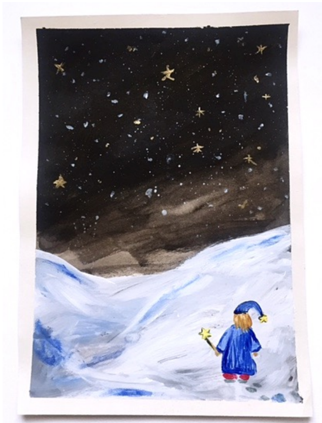
Kuva 4. "Ja näin syntyi sininen..." kuvitus