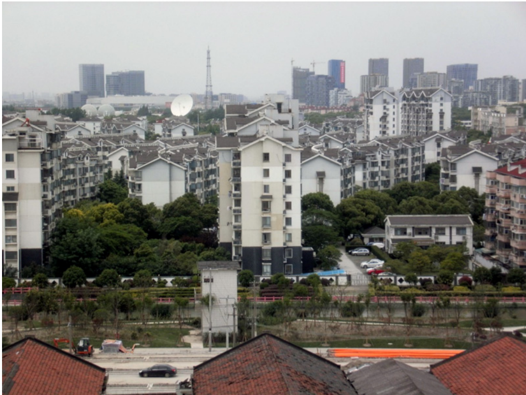
Kuva Salla Seppänen