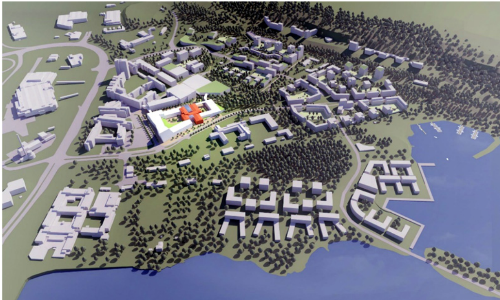
Savonian ja Sakkyn uusi kampus Savilahdessa.