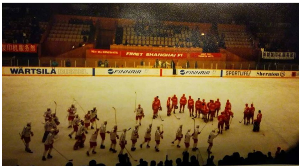
Kalpan edustusjoukkue pelasi Pekingin liikuntapalatsissa 1995.