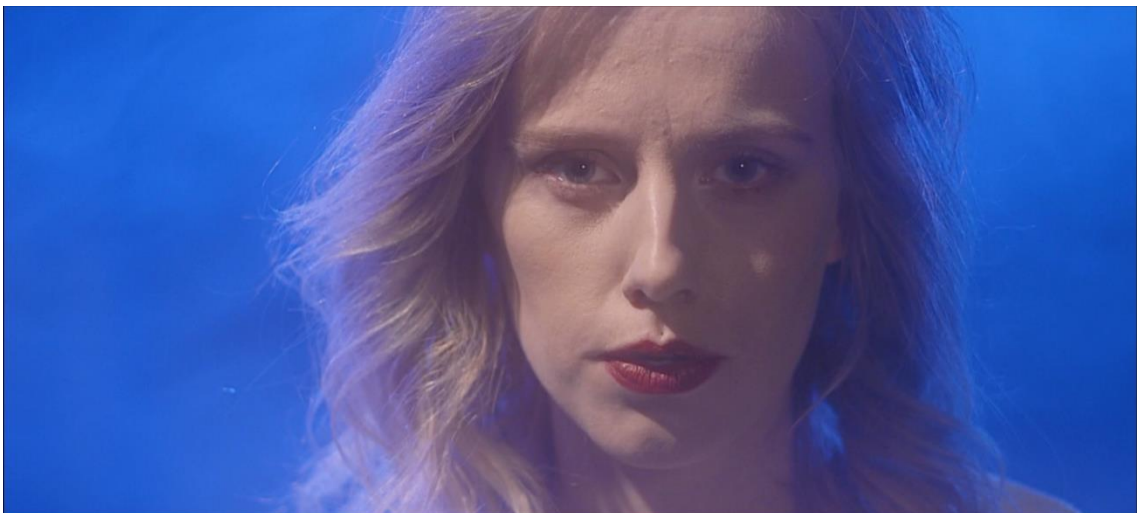
Figur 3 – närbild på kvinnans ansikte

Det är denna förminskning av mannen till en kropp att se på, som gör att bilden känns stel. Kvinnan sjunger till ett objekt (hon kunde lika gärna sjunga till en stol).