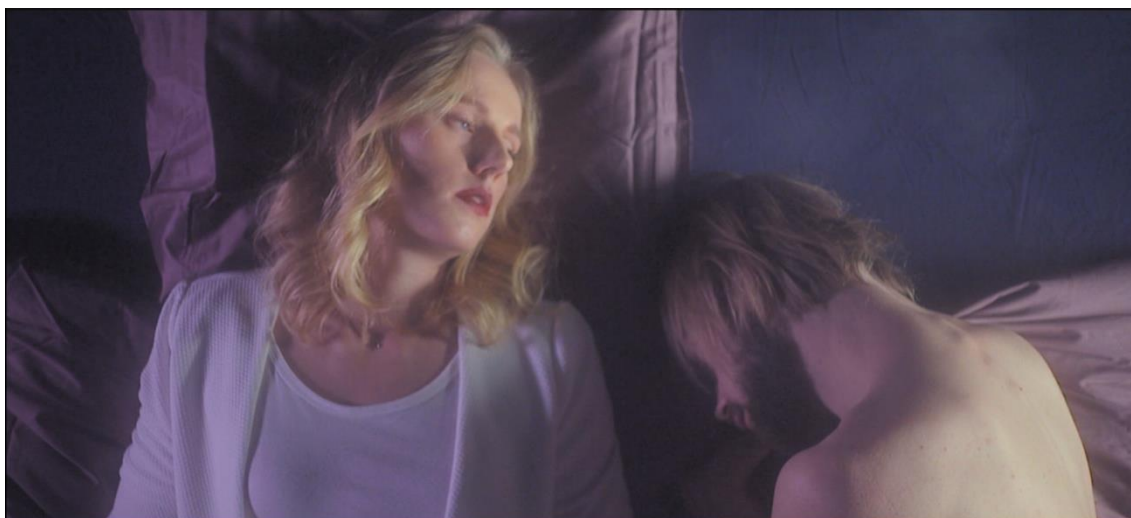
Figur 1 – kvinna och man ligger på en säng

Ovanför (figur 1) är första bilden jag analyserar från videon Mine . I The Weeknds video Often är sängen en central del av bildberättandet. Vi ser The Weeknd både sitta och ligga på den (alltid påklädd) och vi ser kvinnor ligga i den (halvna nakna). I Mine hade vi också ett antal sängbilder, och bild 1 är en av dem. I den ser man båda personerna i musikvideon, vi kallar dem kvinnan och mannen. I musikvideon börjar bilden med en åkning upp längs med kropparna. Vi ser att personerna ligger på en säng, kvinnan har skorna på, mannen är barfota. Vi ser att kvinnan har kläder på sig, mannen är iklädd endast underkläder. Kvinnans högra hand kommer in i bilden, vi ser att hon håller en elektronisk cigarett. Bilden stannar då den kommit upp till deras ansikten. Kvinnan är vaken, hon har ögonen öppna och hon blåser ut rök från munnen och vänder sedan huvudet bort från mannen. Mannen är hopkurad, har ögonen stängda och är vänd mot kvinnan. Det ser ut som att han sover. För att undersöka kvinnans och mannens roller i bilden, använder jag mig av Bergers analys.