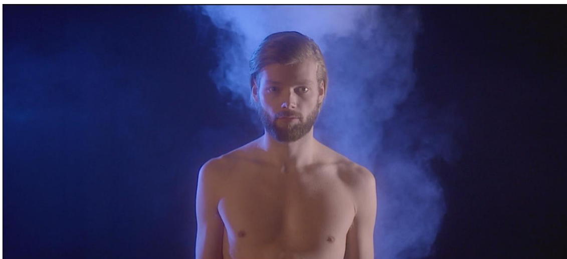
Figur 6 – halvbild på mannen

Figur 5 har alla element av en klassisk närbild på en kvinna, enligt Doanes analys, eftersom den med hjälp av skuggor, avgränsning och rök skapar en barriär (en slöja) mellan kvinnan och åskådaren.