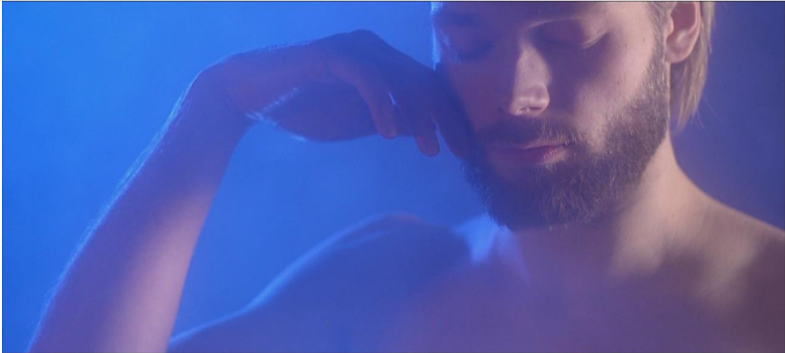
Figur 4 – närbild på mannens ansikte

I figur 3 och 4 ser vi två av de närbilder på personerna som används i musikvideon. Variationer på dessa förekommer i hela musikvideon. Närbilden på kvinnan var inspirerad av närbilder på The Weeknd i musikvideon till Earned It , medan mannens närbilder skapades i kontrast till kvinnans bild. Båda bilderna har blått ljus i bakgrunden och naturligt ljus på ansikten. I kvinnans bild finns det rök i bakgrunden. I mannens bild badar han i rök, den finns framför och bakom honom. Medan båda bilderna har i princip samma bildstorlek (närbilder) så är kvinnans bild en fokusering på hennes ansikte, hon tittar rakt fram in i kameran. I bilden på mannen har han ögonen stängda och bilden rör sig från hans ansikte till hans kropp. Han har ingen personlig kontakt med kameran, det är snarare hans kropp som smeks av åskådaren (kameran).