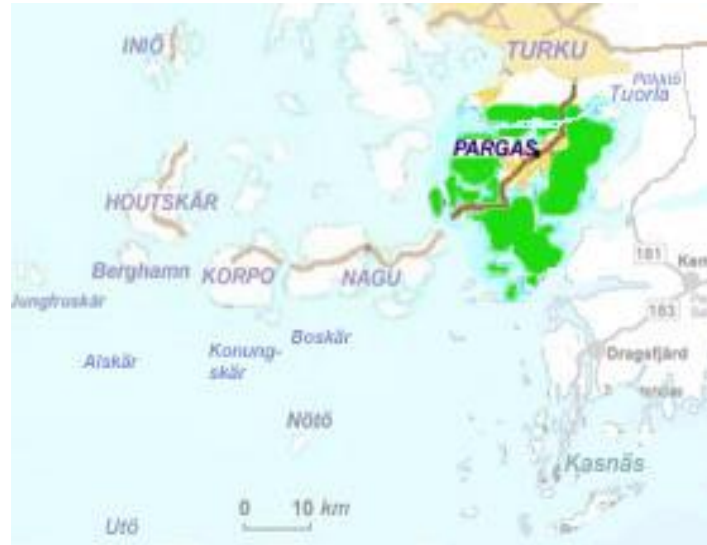
Figur. 1, Pargas centrum och de närliggande öarna som utgör bypolisens distrikt (Suomen saaristo 2017)

Ifall det skulle ske en större olycka eller ett polisuppdrag som är brådskande så är det viktigt att veta utryckningstiderna till dessa områden samt hur den allmänna ordningen upprätthålls. Problem kan uppstå då det sker en situation som kräver snabb utryckning från räddningstjänsten samt polisen och det inte finns effektiva förbindelser till platsen. Då borde man ha färdigt planer.