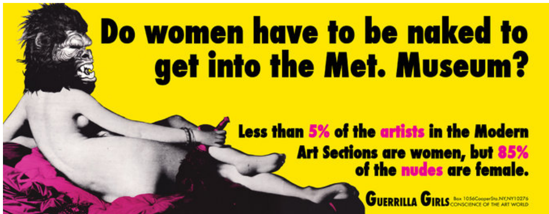
Kuva 2. Guerrilla Girls, Do Women have to be Naked to get into the Met. Museum? 1985, (Guerrilla Girls Home Page 2017)

Naisten kuvaamista eri tavalla ei kuitenkaan selitä vain silmäruokana oleminen. Historiallisesti katsottuna nainen on ollut toisarvoisessa roolissa, niin filosofias- sa kuin uskonnossakin. Jo raamatun tarina naisen luomisesta kertoo, miten Ee- va luotiin vain täyttämään Aatamin, ensisijaisen ihmisen, riittämättömyyttä (Nead 1992, 18). Länsimaalaisessa kulttuurissa halutaan usein asettaa suku- puolet toistensa vastakohtiksi. Tämä ajattelukaava on entisestään vahvistanut naisten erilaista kuvaamista miesvaltaisessa taidejärjestelmässä.