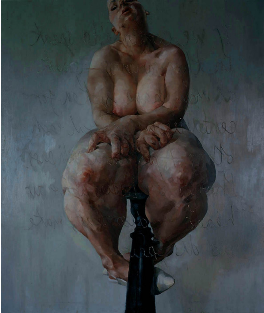
Kuva 5. Jenny Saville, Propped , 1992 (Saatchi Gallery 2017)