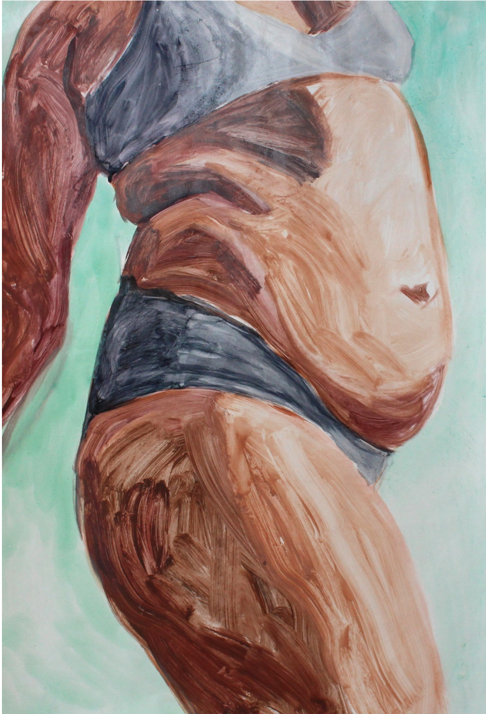
Kuva 8. Maalaukseni (I Keep) Dancing on my Own, 2017