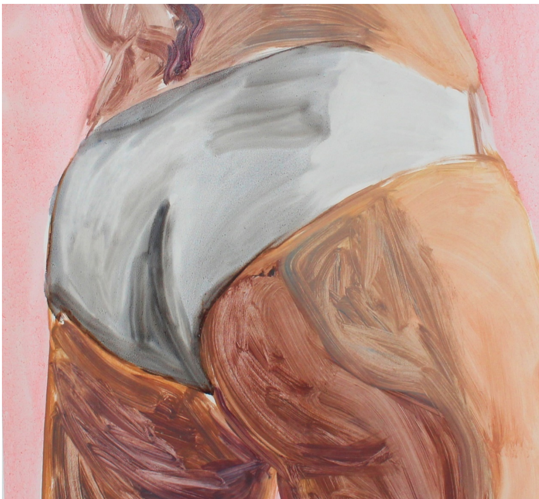
Kuva 10. Yksityiskohta maalauksesta Bubble Butt, 2017

Paperi kiinnostaa minua materiaalina myös sen huonomman arvostuksen takia. Usein paperille tehdyt työt hinnoitellaan eri tavalla, vaikka ne materiaalina maksaisivat saman verran kuin kangas. Toisaalta paperi on materiaalina paljon kangasta hauraampaa. Ajatus halvan ja epäsuositun materiaalin käyttämisestä kuitenkin kiinnostaa minua. Mielestäni paperi sopii hyvin yhteen valitsemani aiheen kanssa, sillä haluan tuoda arvostusta myös kuvaamilleni kehoille. Myös perinteisten tekotapojen kyseenalaistaminen kiinnostaa minua.