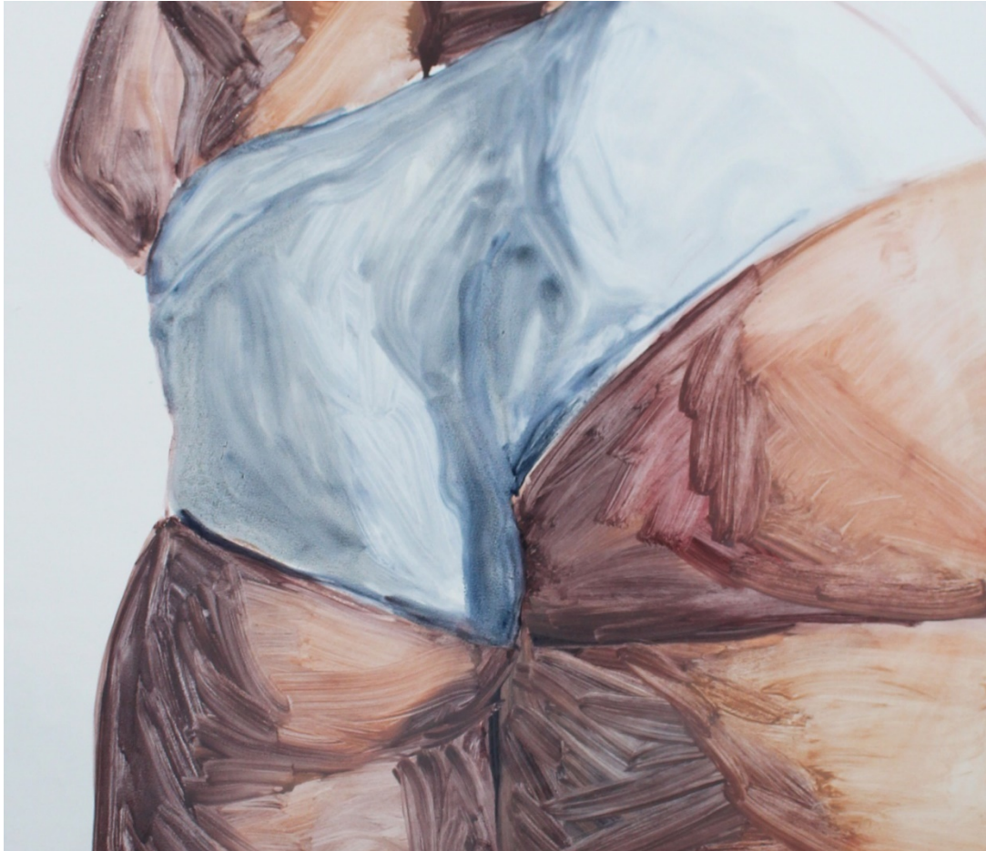
Kuva 9. Yksityiskohta vielä keskeneräisestä maalauksesta, 2017