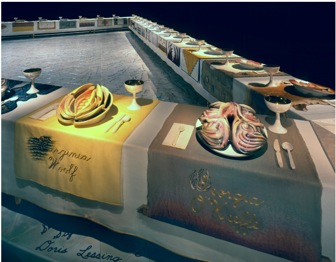
Kuva 4. Judy Chicago, The Dinner Party , 1979 (Judy Chicago Home Page 2017)

Ikonisin esimerkki vaginaalisten kuva-aiheiden käytöstä on Judy Chicagon installaatio The Dinner Party . Installaatiossa on aseteltu kolmion muotoiselle pöydälle 39 uniikkia kattausta kuvastamaan, niin mytologisia kuin historiallisiakin, naisia. Jokaisessa kattauksessa on henkilön mukaan kirjailtu kaitaliina, aterimet ja uniikki posliinimaalattu lautanen, jonka muotokieli viittaa vaginaan (Kuva 4). (Nead 1992, 65.)