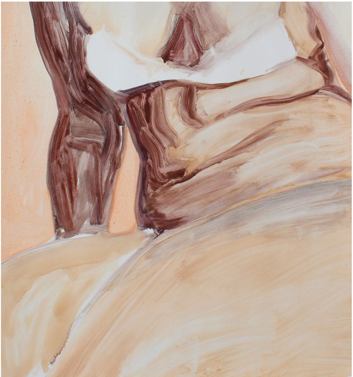
Kuva 7. Yksityiskohta teoksestani Peach Body, 2017

Maalauksia varten ottamissani kuvissa leikittelen usein perspektiivillä tai kuvien elementtien etäisyyksillä. Alhaalta ylöspäin otetut kuvat tuovat kuviin asennetta ja uhmaa. Elementtien etäisyydet suhteessa kameraan saavat myös eri ruumiinosien mittasuhteet muuttumaan. Esimerkiksi maalauksessani Peach Body olevan figuurin reidet näyttävät suuremmilta, sillä ne ovat muuta vartaloa lähempänä kameraa (Kuva 7). Opinnäytetyöohjaajani Aura Hakuri huomauttikin humoristisesti maalauksen reisien muistuttavan ”kukkuloita” maisemassa.