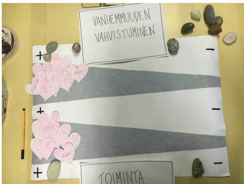
Kuva 4: Toisen toimintakerran palaute

Toinen toimintakerta erosi paljon ensimmäisestä sekä osanottajamäärältään että sen vuoksi, että olimme valmistautuneet ajallisesti paremmin tähän kertaan. Tällä kerralla saimme vietyä suunnittelemaamme kokonaisuuden loppuun eli purimme vanhemmuuden käsi-toiminnan yhteisesti. Merkille pantavaa oli, että kaikilla kerroilla osallistujat työskentelivät intensiivisesti ja osallistuivat aktiivisesti keskusteluun. Palaute toiselta toimintakerralta oli positiivinen ja osallistujat vaikuttivat tyytyväisiltä (Kuva 4.). Meillä itsellämme ohjaajina ammatillinen ryhmän ohjaaminen vahvistui. Ymmärsimme, että selkeä etukäteen mietitty ohjeistus on tärkeää kokonaisuuden toimivuuden kannalta. Hyvä ohjeistus myöskin säästää aikaa ja työskentelyn alkuun pääseminen on mielekkäämpää kaikille.