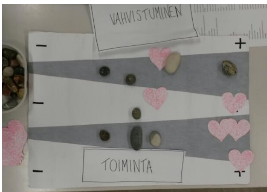
Kuva 5: Kolmannen toimintakerran palaute

Kolmas toimintakerta toimi hyvin ja sujuvasti vaikka toiminnan kesto oli pidempi. Palautteeseen vastasi yhdeksästä naapuriäidistä kahdeksan (Kuva 5.). Toiminnallisesta osiosta kolme naista koki toiminnan olleen mieluisa ja hyvä, kun taas kaksi oli sitä mieltä, että se ei ollut kiva, mutta ei huonokaan eli kivet olivat palaute-janalla puolivälissä. Yksi nainen oli enemmän sitä mieltä, että toiminta ei ollut niin mieluisaa. Kaksi palautetta oli molempien janojen välissä, joten nämä naiset arvioivat toimintaa ja vanhemmuuden vahvistumista vain yhdellä vastauksella ja nämä olivat molempien janojen puolivälissä. Palautteen hajanaisuudesta huolimatta naiset olivat tyytyväisiä tämän kerran toimintaan, joka tuli esille koko tapaamisen lopuksi heidän kiitoksilla.