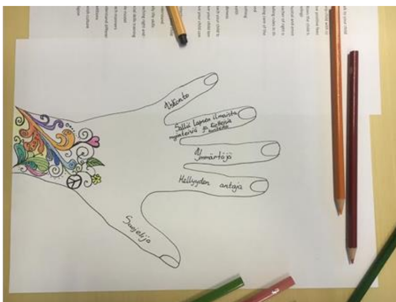
Kuva 2: Vanhemmuuden käsi yhden osallistujan tekemänä

Ensimmäisellä kerralla osallistujat tulivat kaikki eri aikaan paikalle, joten jokainen sai henkilökohtaisen ohjeistuksen. Varmistimme myös myöhemmin, että he ovat ymmärtäneet ohjeistuksen tarjoamalla apua. Toisella ja kolmannella ohjauksella osallistujia oli useampi paikalla jo aloitusvaiheessa, joten ohjeistuksen ei tarvinnut olla niin henkilökohtaista. Vanhemmuuden kädet valmistuivat eri tahtiin ja viimeisiä jouduttiin hieman jouduttamaan kaikilla toimintakerroilla.