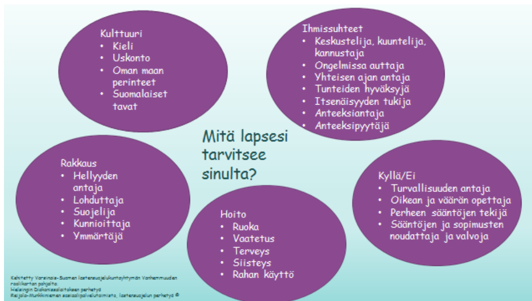
Kuvio 2: Vanhemmuuden roolikartta maahanmuuttajille (Tolonen 2016)

Maahanmuuttajan roolit ovat sidoksissa siihen maahan, kulttuuriin ja sosiaaliseen ympäristöön, jossa hän on asunut ja johon hän on muuttanut. Yleensä maahanmuuttaja kokee tarvetta omien roolien vaihtamiseen, mutta moni ei ymmärrä minkälaisia muutoksia heidän pitäisi tehdä ja miksi. Maahanmuuttajavanhemman olisi hyvä itse kyetä jäsentämään maahanmuuttoon liittyviä kokemuksia ja tunteita, sillä sitä paremmin hän ymmärtää muutoksen vaatimukset ja seuraukset. Samalla hänen on helpompi muokata omia roolejaan ja hallita omaa sopeutumistaan yhteiskuntaan. Sopeutuessaan hän hyväksyy itsessään ja perheessään tapahtuvia muutosprosesseja ja roolien sopusointua yksilön, perheen ja ympäristön odotusten kanssa. Muutosta ei kuitenkaan tapahdu, ellei julkisen sektorin työntekijä anna asiakkaalle riittävää tietoa uudesta yhteiskunnasta. Asiakkaalle on annettava mahdollisuus sekä aikaa omien roolien etsimiseen ja käsittelyyn. Roolit saattavat muuttua yhteiskunnan ja ympäristön odotusten perusteella joskus radikaalisti ja aiemmin tutut roolit saattavat menettää merkityksen. Uusien roolien omaksuminen ja niihin sopeutuminen vaativat aikaa ja harjoittelua. (Alitolppa-Niitamo ym. 2005, 73-77.)