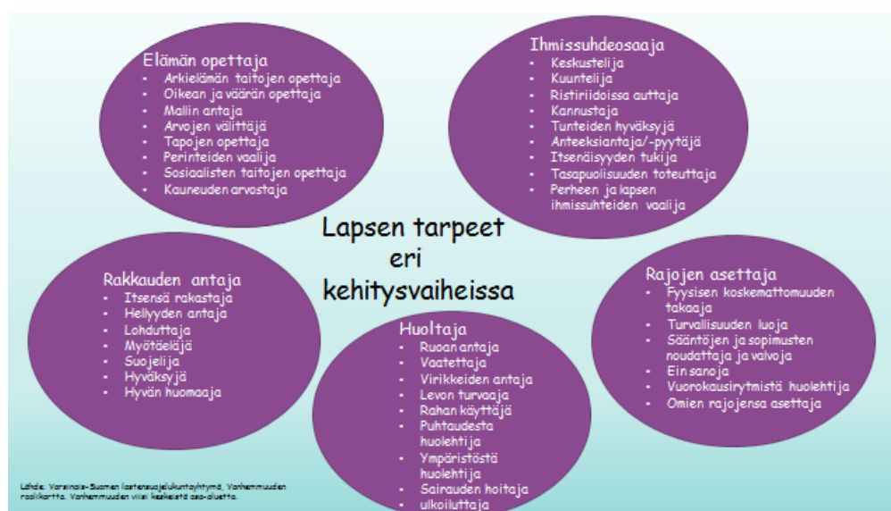
Kuvio 1: Vanhemmuuden roolikartta (Varsinais-Suomen Lastensuojelukuntayhtymä 2013)

vanhempaa havaitsemaan vanhemmuuden ongelmallisia alueita sekä auttaa vanhempaa tunnistamaan omat vahvuutensa ja luottamaan muutoksen mahdollisuuteen. (Ylitalo 2011, 9-10.)