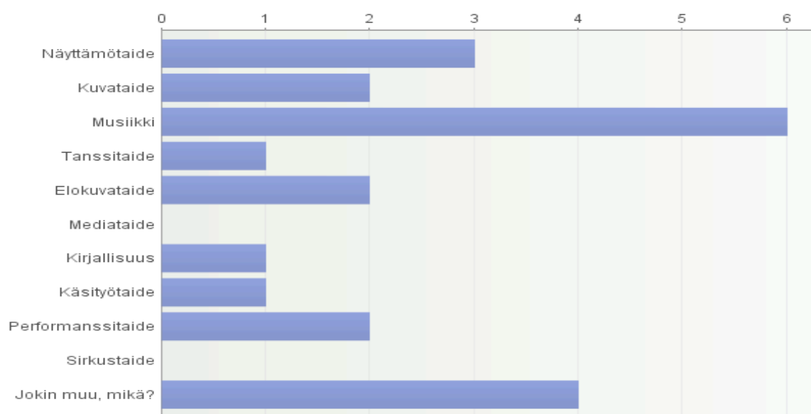
Kuva 1. Vastaajien edustamat taiteenlajit.