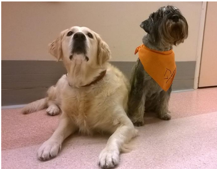
Kuva 2. Justiina ja Tilli

Molempiin toteutuneisiin vierailuihin osallistui kaksi koirakkoa. Ensimmäinen vierailu saatiin toteutettua tammikuun 11. päivänä, sunnuntai-iltapäivänä, kello 13.15 - 15.00 Palvelukeskus Kallion tiloissa. Kaverikoirista saapuivat paikalle kulta-noutaja Justiina sekä snautseri Tilli ohjaajineen (KUVA 2). Koirakot saapuivat paikalle hieman etujassa ja se aiheutti pientä sekaannusta alkuvalmistelujen ollessa vielä vaiheessa. Aikataulu piti suunnitellusti. Henkilökuntaa osastoil-la on sunnuntaisin arkipäiviä vähemmän, joten olimme avustamassa ennalta sovit-tuja ikäihmisiä saapumaan vierailutilaan. Haimme muun muassa erään nais-henkilön pyörätuolilla kuljettaen alakertaan.