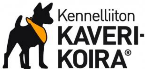
Kuva . Kennelliiton kaverikoiratoiminnan logo

mitystä koirakko. Kaverikoiratoiminta jakautuu paikallisiin ryhmiin, joissa paikalliset yhteyshenkilöt vastaavat vierailukohteiden ja kaverikoirien ohjaajien välisestä yhteydenpidosta ja uusien henkilöiden kouluttamisesta. Kainuun kaverikoirat aloittivat toimintansa vuonna 2012 (Kainuun kaverikoirat, 2015).