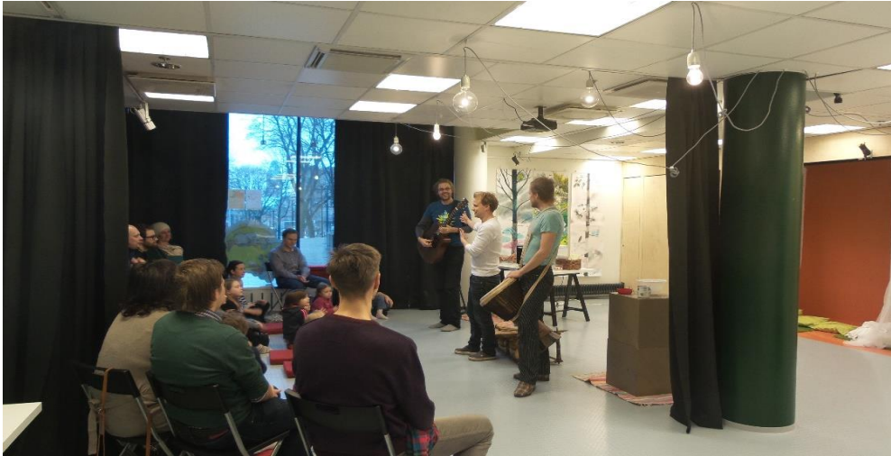
Bild 8. Saftsalong Var bor Onni? Helsingfors 2015.