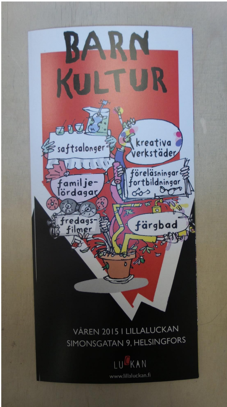
Bild 11. Barnkulturbroschyren 2015. Helsingfors 2015.