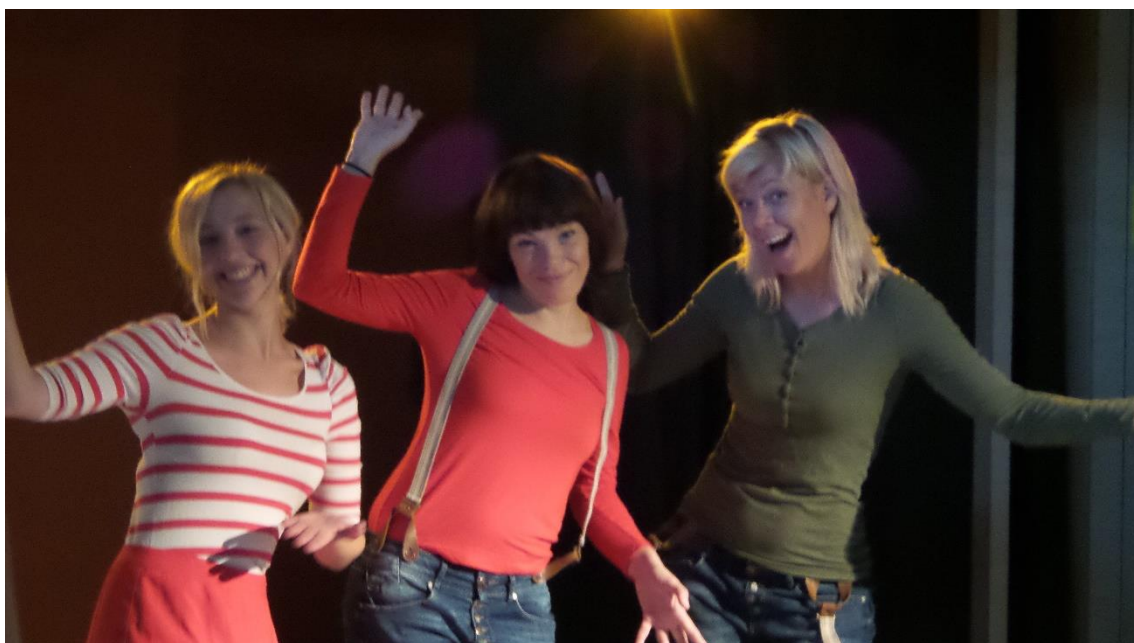
Bild 5. Saftsalong Muminkonsert. Helsingfors 2014.

Saftsalongen är utan tvivel LillaLuckans populäraste evenemang. Konceptet kördes igång 2003 och antalet salonger har stadigt vuxit sedan dess. 2014 gavs tolv saftsalonger, alltid på lördagar. Det är professionell scenkonst för barn. LillaLuckan bjuder in teatergrupper, musiker och andra artister att uppträda mot ersättning. LillaLuckan köper alltså en evenemangstjänst och publiken köper biljetter. Det är alltid fullt hus på Saftsalongerna och man kan se på barnen att de verkligen njuter av att vara där. Saftsalongerna är den största orsaken till att människor lockas till LillaLuckan.