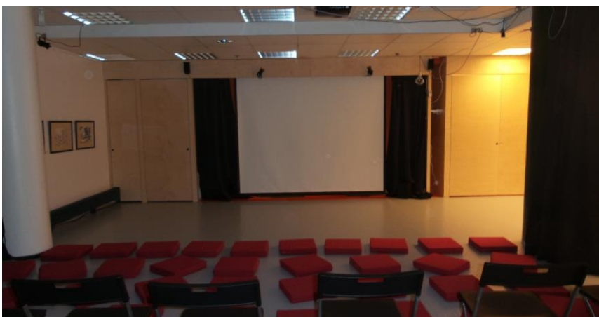
Bild 9. Familjelördag filmvisning. Helsingfors 2014

Familjelördagar är ett evenemang för hela familjen som skiljer sig från Saftsalongerna genom att det är gratis. Organisationer och aktörer har möjlighet att komma och hålla olika aktiviteter som t ex verkstäder, filmvisningar eller teater. Arrangören får på detta vis ny publik och gratis lokal. LillaLuckan står för marknadsföringen. Familjelördagarna är, liksom Saftsalongerna, den största orsaken till att människor lockas till LillaLuckan.