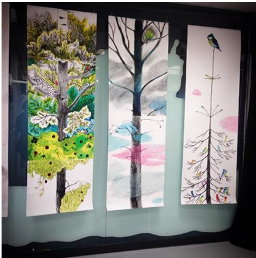
Bild 10. Emmi Jormalainen. Helsingfors 2015

lighet. De kan också hämta sina produkter (kort, böcker, affischer m.m.) och ha till försäljning i LillaLuckan.