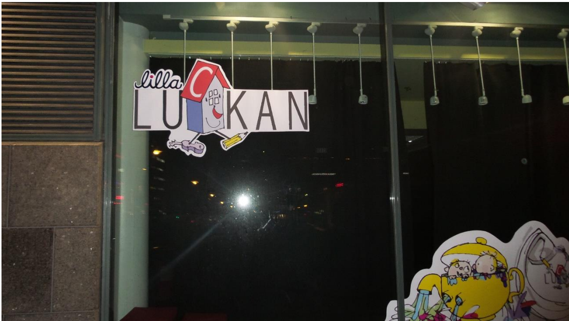
Bild 1-4. Bilder av LillaLuckan. Helsingfors 2014