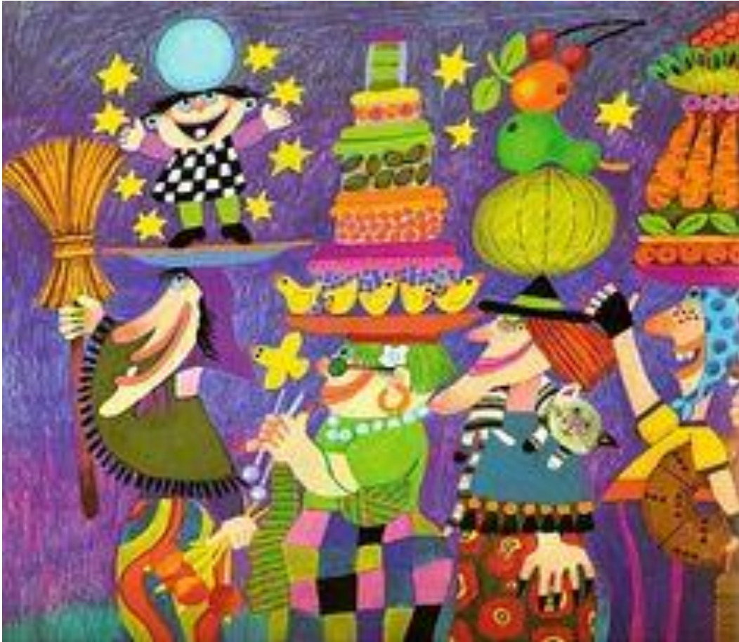
Filmvisning "Emilias vänner" av Camilla Mickwitz