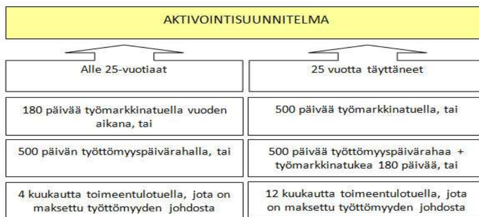
Kuvio 2. Aktivointisuunnitelman laatimiseen kutsuttavat (Kuntouttavan työtoiminnan käsikirja 2015.)

Laki kuntouttavasta työtoiminnasta (189/2001) velvoittaa kuntaa (Kotikuntalaki 201/1994) ja työ- ja elinkeinotoimistoa laatimaan aktivointisuunnitelman työttömälle asiakkaalle, joka saa työmarkkinatukea tai toimeentulotukea. Aktivointisuunnitelma tulee laatia yhteistyössä asiakkaan kanssa. Vastuu aktivointisuunnitelmaprosessin käynnistämisestä on sen viranomaisen, jonka pääasiallinen asiakas on kyseessä. Kun kysymyksessä on työmarkkinatukea saava asiakas, on työ- ja elinkeinotoimisto velvollinen käynnistämään suunnitelman tekemisen. Kun kysymyksessä on toimeentulotukea saava asiakas, kunta on velvollinen käynnistämään suunnitteluun liittyvät toimenpiteet. (Kuvio 2.) Aloitteen tekevä viranomainen on myös velvollinen tarvittaessa etukäteen valmistelemaan asiaa toisen viranomaisen kanssa. (Terveys- ja hyvinvoinnin laitoksen www-sivut 2015.)