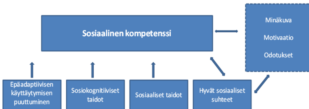
KUVIO 1. Sosiaalinen kompetenssi Salmivallin mukaan (Salmivalli 2005, 73)