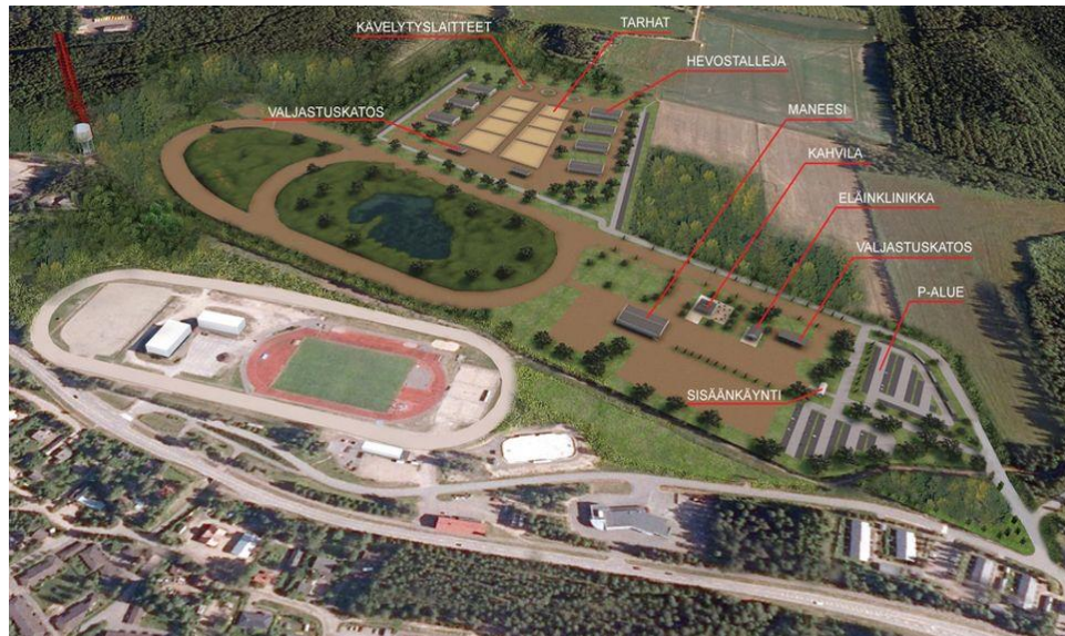
Kuva 2. Havainnekuva alueen rakennelmista. (Iitin Hevoskeskus, 2012.)

Hanketukihakemus jätettiin 29.4.2011. Hanketta edisti sopivan alueen löytyminen keskeiseltä paikalta, hyvien kulkuyhteyksien varrelta sekä Iitin kunnan myötämielinen asenne hankkeeseen. (Tiira, T. Sähköpostiviesti. 2013).