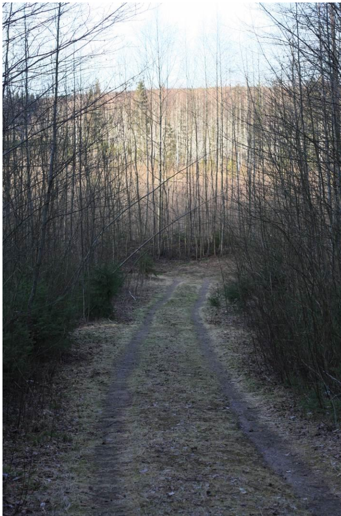
Kuva 8. Hakkuualueelle johtava yhdystie 28.4.2015.

Seurassa 11.11.2013 hyväksytyt sopimuksen mukaan yleishyödylliselle alueelle on rakennettava vuoteen 2018 mennessä hiittisuora, harjoitusrata, valjastuskatos sekä alueelle johtava yhdystie (Kuva 8). Mikäli rakennelmien sekä radan rakentamista ei ole saatu toteutettua vuoden 2018 loppuun mennessä, on seuralla oikeus hakea jatkoaikaa toteuttamiselle.