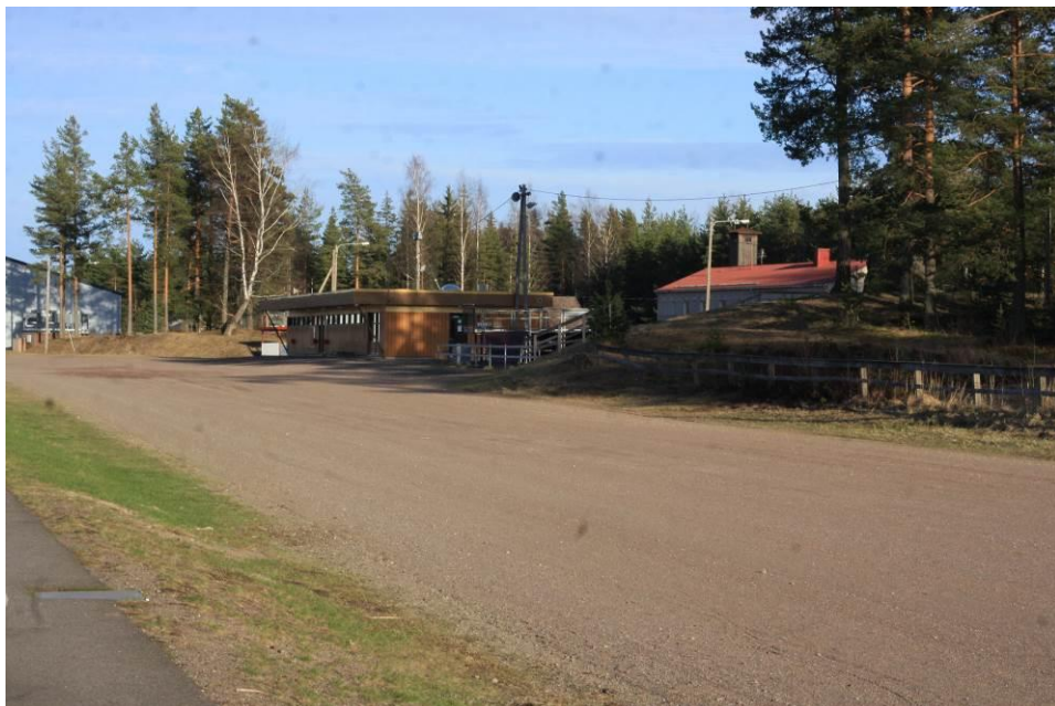
Kuva 4. Kausalan kesävirata.