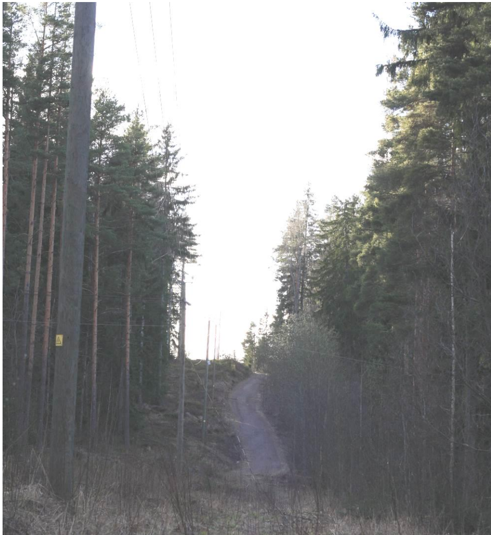
Kuva 1. Alueella on selkeitä korkeuseroja harjoitteluareittien monipuolistamiseksi.

Hanke sai alkunsa jo vuonna 2010, kun Iitin hevosystäväinseuran jäsenistön mielestä hevosten täysmittainen liikuttaminen ja treenaus oli käymässä liian vaikeaksi ja vaaralliseksi kylä-, metsä- ja peltoteillä. Enenevässä määrin useat tiekunnat ovat kieltäneet hevosten ajon teillä vedoten kasvaviin tienhoitokustannuksiin hevosten aiheuttaman tienpinnan kulumisen takia. Tämän johdosta hevosystäväinseura alkoi pohtia ratkaisua paremmille ja turvallisemmille harjoittelumahdollisuuksille, jolloin idea keskitetystä hevoskeskustoiminnasta nostettiin esille. Ajatuksena oli niin harjoitusajoreittien ja –radan, kuin hiittisuorankin tekeminen.