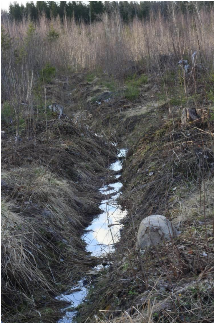
Kuva 6. Alueella on kaivettu kuivatusojia. 28.4.2015.