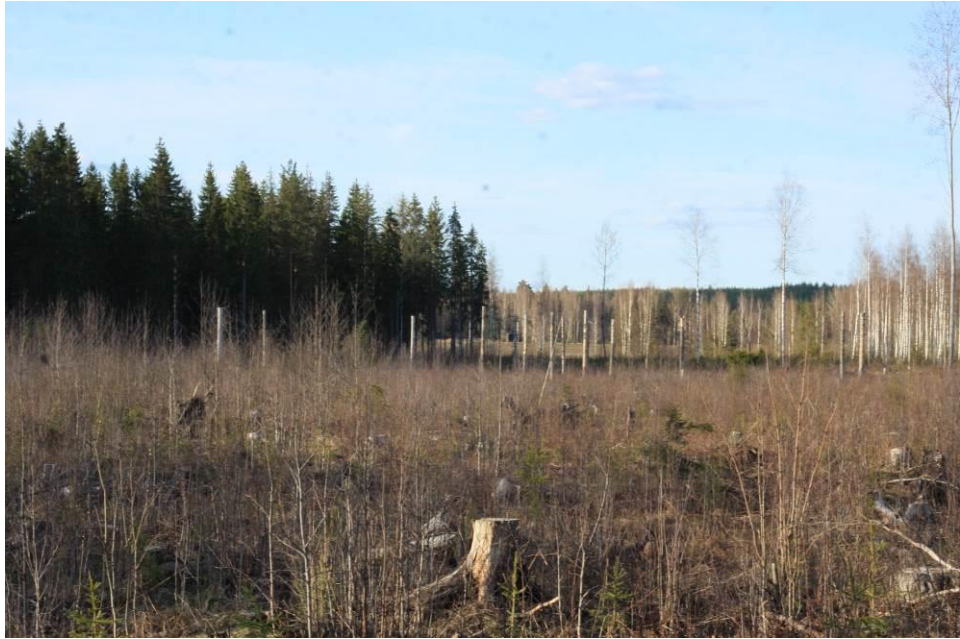
Kuva 5. Alueen ilme 28.4.2015 Ravilinnan suunnalta kuvattuna.